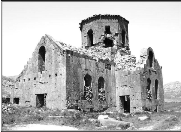
Kızıl Kilise, (Foto.: Savaş Ulukaya)

Aksaray'ın ilçelerinden eski ismiyle Karballa ve Gelveri yeni ismiyle Güzelyurt bu açıdan çok önemli ve