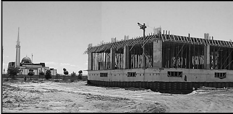
Fakülte binamızın inşaatı. 17.06.2014