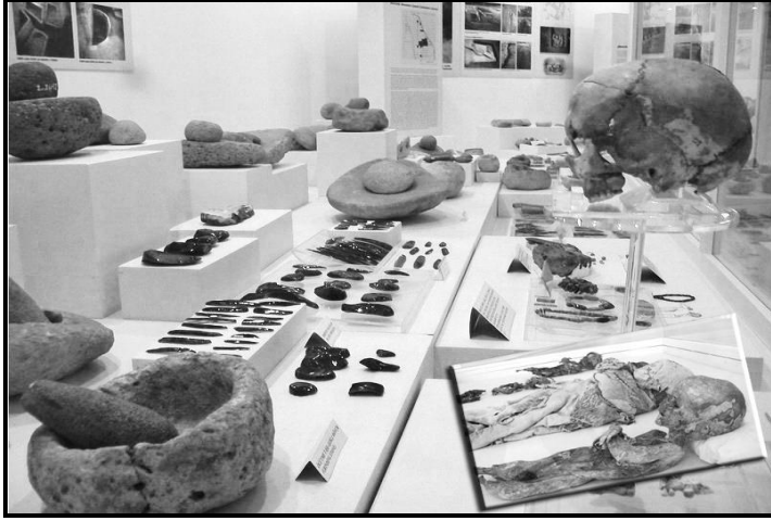
Aksaray Müzesinden bir kesit, (Foto.: Savaş Ulukaya)

İslami dönem öncesi sürecinde Aksaray ve çevresi özellikle Hristiyanlık açısından çok önemli bilgi ve kalıntılar barındırmaktadır. Hristiyanlık öncesi Roma İmparatorluğunun baskıları altında yaşam savaşı veren hristiyan unsurların bölgenin tabii korunaklı vadi ve yumuşak volkanik kayalar içerisinde oluşturdukları barınaklarda gizlendikleri kabul edilmektedir. Romanın hristiyanlığı kabul ettiği dönemlerden itibaren ise hristiyanlar rahatlamış ve bölgede uzun yıllar yaşamlarını sürdürmüşlerdir. İslami dönemde de bu tabii korunaklı yerleşim yerlerinin kullanılmaya devam edildiği anlaşılmaktadır. Bu nedenle Aksaray ve çevresi farklı tarihi ve mimari özellikler taşıyan bazıları mâmur, bazıları ise harap durumda çok sayıda kilise barındırmaktadır. 5