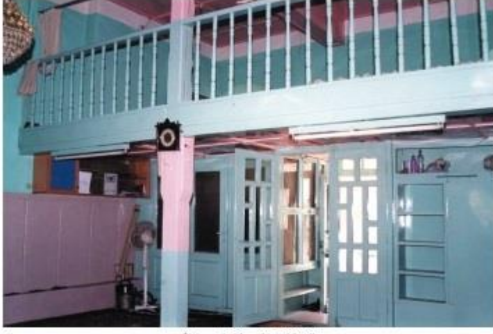
İhtiyaruddin Mescidi'ne Mahfil