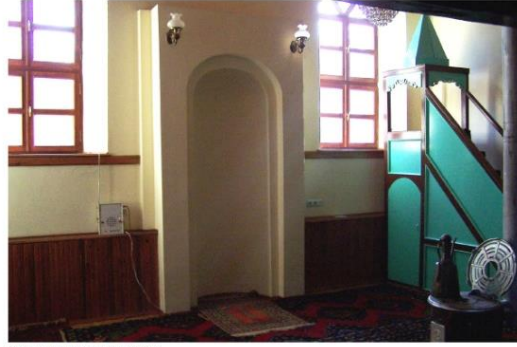
Mihrap ve Minber Görünüşü

lanmaktadır. Kible ve karşısındaki cephede ikişerden dört pencere mevcuttur. Yuvarlak kemerli pencereler iki kanatlıdır ve sonraki dönemlerde yenilenmiştir. Tavan kontrplak kaplıdır. Mihrap ve minber sanatsal karakterli olmayıp sonraki dönem ilavesidir.