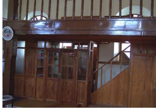
Kadınlar Mahfili Görünüşü