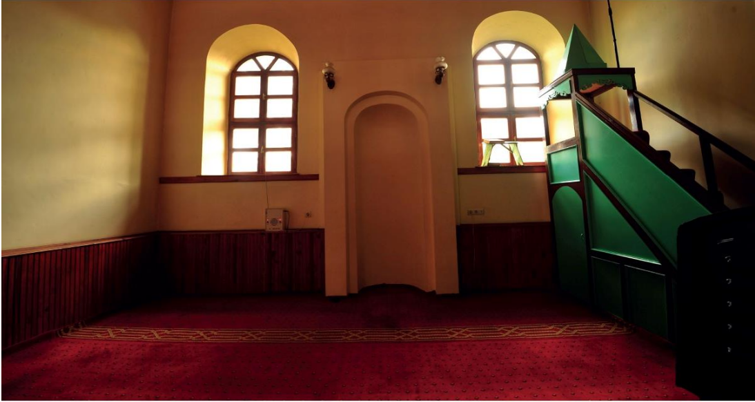
Ek 2. İhtiyârüddin Hasan Camii'nin son hâli ve iç görünümünden bir kesit (Boran, Meram , 1/392)