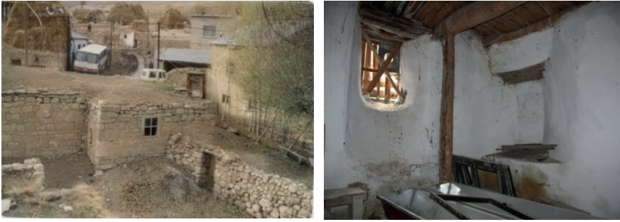
Fotoğraf 13: Cennetpınar köyü camisi doğu yönündeki mektep (Köy odası).

Hem iç hem de dış tarafta kapı üzerinde kitabe yer almaktadır. Bu mekân kare planlı olup düz ahşap tavan ile örtülüdür. Doğu ve güney yöne iki adet pencere açılmaktadır ( Resim12 ). Bu oda, doğuya doğru asıl mekândan 2 m. taşını yapmaktadır ( Resim12 ). Batı yöndeki oda ise, ortada iki, yanlarda sekiz ahşap destek üzerine oturan düz ahşap tavanla örtülüdür ( Resim13 ). Bu mekânların dıştan toprak damla örtülü olduğu arşiv fotoğraflarından anlaşılmaktadır. Bu odada bir adet kuzey yönde pencere açıklığı bulunmaktadır. İki odanın da boyutları birbirine yakındır. Bu mekânları birbirine bağlayan koridordan kuzey yöndeki harime giriş sağlayan kapı yer almaktadır.