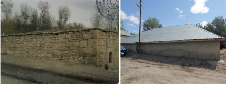
Fotoğraf 8 / 9: Caminin batı tarafından ayrı iki görünüm

Caminin batı cephesi, yola bakmaktadır. Cephenin kuzey tarafına denk gelen giriş bölümünün 60 cm. kadar dışa taşıntı yaptığı görülmektedir. Batı duvarı yol üzerindeki giriş kapısına kadar uzatılmıştır. Bu cephe sağır tutulmuş olup diğer cephelerden farklılık göstermektedir ( Resim8 / Resim 9 ).