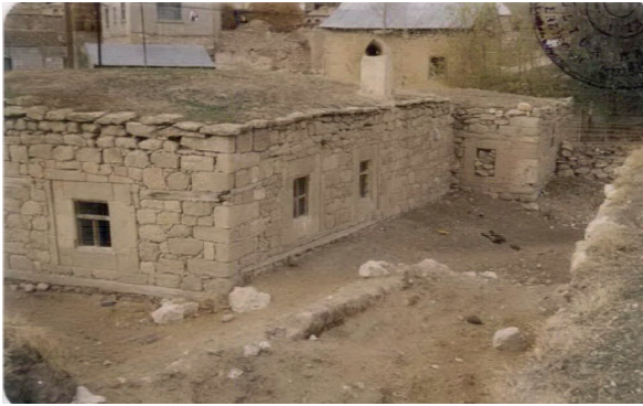
Fotoğraf 4: Caminin doğu cephesi (Erzurum Kültür Varlıklarını Koruma Bölge Kurulu Arşivi, 1992).