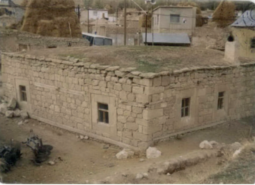
Fotoğraf 7: Caminin gùney cephesi (Erzurum Kùltür Varlıklarını Koruma B6lge Kurulu Arřivi, 1992).