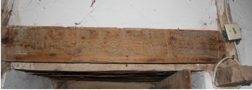
Fotoğraf 2: Cennetpınar köyü camisinin doğu yönündeki mektep kapısının arka yüzündeki kitabe.

Mihrapta yer alan kitabede 1693-94 yılı yazılıdır ( Resim 3 ). Bu kitabenin okunuşu “Sene H.1105/M.1693-94 Muhammed Allah Celle Celâluhu (C.C)” ve “Ketebehu Fazıl Ya Allah vevelli vecheke şatre'l-mescidi'l-haram (Muhammed A.S.)”(mikdat) 5 şeklindedir.