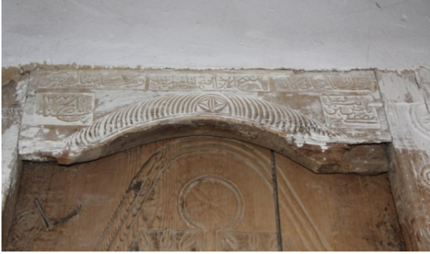
Fotoğraf 1: Cennetpınar (Aşağı Tolos) köyü camisinin doğu yönündeki mektep kapısının üzerindeki kitabe.

3. Men câ'e bi'-haseneti felehu aşru emsaliha,