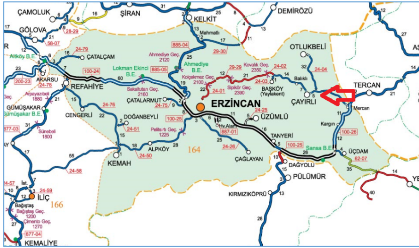
Harita 1: Erzincan haritası.

Cennetpınar köyü, Çayırılı ilçesinin 20 km. kuzeybatısındadır. ( Harita 1 ). Cennetpınar köyünün eski ismi Aşağı Tolos olarak geçmektedir. Eski adıyla Tolos-ı Süfla (Aşağı Tolos) bugünkü adıyla Cennetpınar köyü, 1516 yılında kimsenin oturmadığı harap bir köydür. 1 Köyün içinde bulunan caminin 2 çevresi beton duvarla örülerek sokaktan ayrılmıştır. Camiye giriş kapısından sonra doğusundaki mektebe açılan kapının üst kısmında “ Maşallahu ta’âlâ kâne