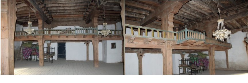
Fotoğraf 17/18: Cennetpınar köyü camisinin iç mekânından görüntüler.