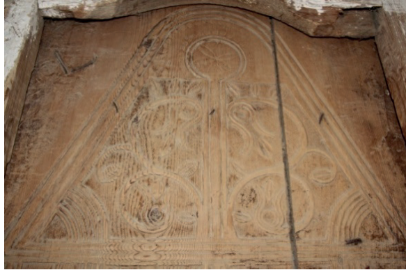
Fotoğraf 19/20: Caminin doğu yönündeki mektep kapısı ve kapıdan detay.