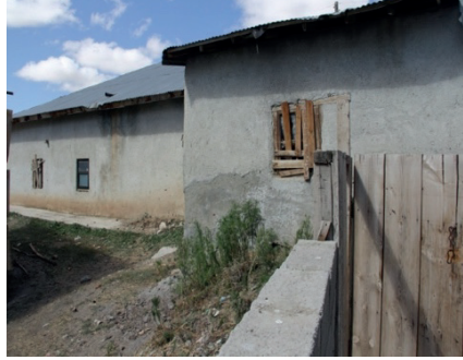
Fotoğraf 5: Caminin dođu cephesinde tařıntı yapan b6lümü.