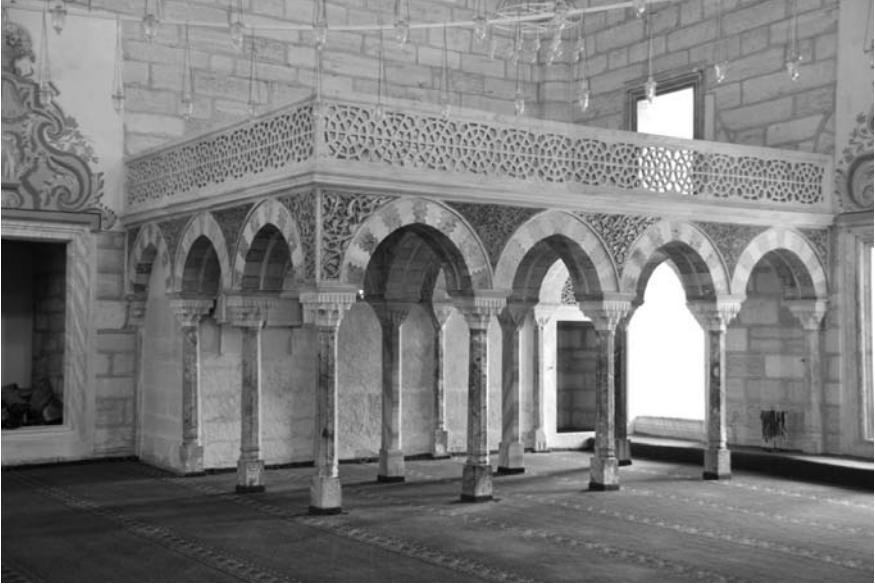
1. Fotoğraf: Edirne 2. Bayezid Camisi hünkâr mahfilinin genel görünüşü.