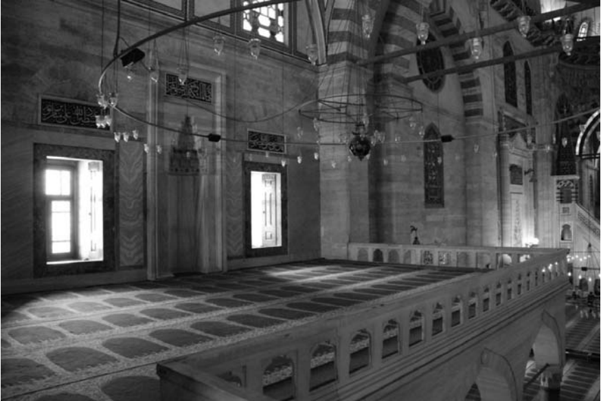
2. Fotoğraf: İstanbul Süleymaniye Camisi hünkâr mahfilinin genel görünüşü ve mihrabiyesi.