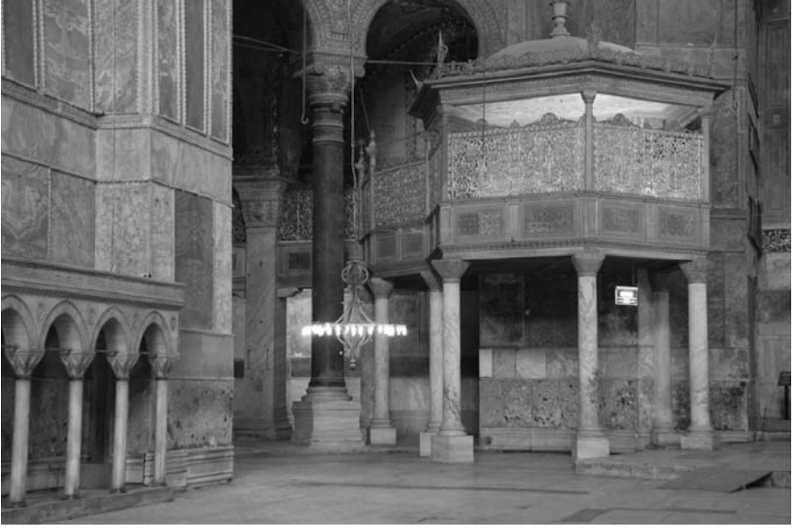
5. Fotoğraf: İstanbul Ayasofya Camisi hünkâr mahfilinin genel görünüşü.