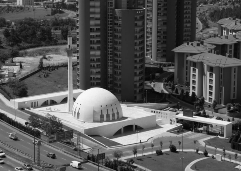
Fotoğraf 1: Yeşil Vadi Camii ve Sitesi: Cami, site girişi ile TEM otoyolunun arasındadır. Cami arkasındaki mimariden kopuk çeşitli boydaki bloklar ise Yeşil Vadi Konakları sitesine ait yapılarıdır.

Amacımız ne dini yargılamak ne de belli bir cami mimarisi anlayışını ortaya koyan mimarı suçlamaktır.