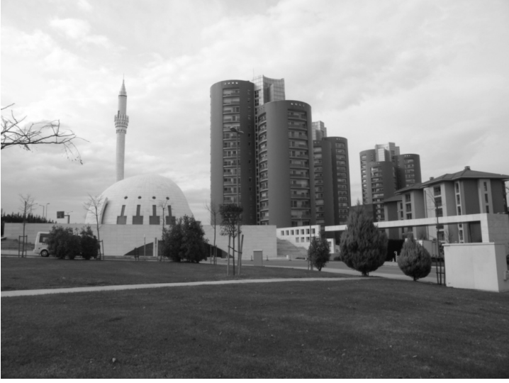
Fotoğraf 2: Yeşil Vadi Camii, Yeşil Vadi Konaklarının kimliğini belirten bloklar ve Yeşil Vadi Konakları site girişi (soldan sağa).

İslâmiyet ve camilerin bir özelliği toplumun birlik ve dayanışmasını, ortaklığını sağlamasıdır. Kapalı site anlayışı ile din anlayışını uzlaştırmakta belli güçlükler vardır. Dindeki dayanışma / ortaklık toplumlararası ilişkiler çerçevesinde ortaya çıktığı için belli bir uygarlığın da temsilini / kimliğini üstlenmektedir. İbadet etmek isteyen insanlar evlerinde ya da başka ortamlarda bireysel olarak ibâdet edebilirler, fakat İslâmiyet “birlikte” ibâdet etmeye ayrı bir önem atfetmektedir. Bu gelenek içinde bireyin uyumuna karşıt değildir, bireyselliğe genel toplum çözümü içinde izin vermektedir. Bireyselliği ezen, genel toplum çözümünün ve uyumun dışına çıkan tekke ve tarikatlardır. Bunlar bütün İslâm tarihi ve Osmanlı toplumunda resmi din anlayışının dışında ve marjinal olarak kalmışlardır. 3 İslamiyet’te cemaat ile yapılan ibâdetlerin toplumsal manada dayanışma ve paylaşım ruhunu arttıran bir anlamı bulunmaktadır. Bu manada, namazın birlikte kılındığı dini mekân olarak camilerin toplumsal bir işlevi vardır. Anadolu Selçuklu ve Osmanlı dönemlerinde devlet sınırları içinde bulunan her kentin merkezine Cuma namazlarının topluca kılındığı büyük cami olarak “ulu cami” inşa edilmiştir. İslâm inancında beş vakit namaz pek çok yerde tek başına kılınabilmektedir. Cuma, bayram, teravîh ve cenaze namazlarının ise cemaatle kılınması gerektiğinden topluca kılınacak namazlar için