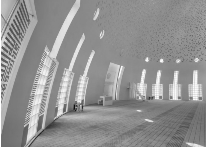
Fotoğraf 6: Yeşil Vadi Camii'nin içinden bir görünüm. Cami toplum kimliğinin ifadesi olmak yerine dar cemaat (dayanışması) anlayışına uygundur. Dar cemaat dayanışmasıyla dinin özelleşmesi/parçalanması cami anlayışına yansımıştır.

den ve kimlikten kopuş haline dönüşmektedir. Bu nedenle gelenekten söz edilmesine rağmen gelenek giderek özelleşmekte, toplumsal işlevinden ve toplumsal çözümden bağımsız bireysel bir çabayı / yorumu belirtmektedir.