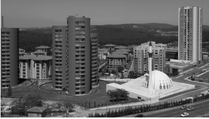
Fotoğraf 8: Yeşil Vadi Camii Konakları içinde Yeşil Vadi Camii. Site içerisinde odak Yeşil Vadi Camii alındığında cami ayrı ve küçük bir yapıdır. Camiye odaklanıldığında siteye ait bütünlük görülmemektedir.