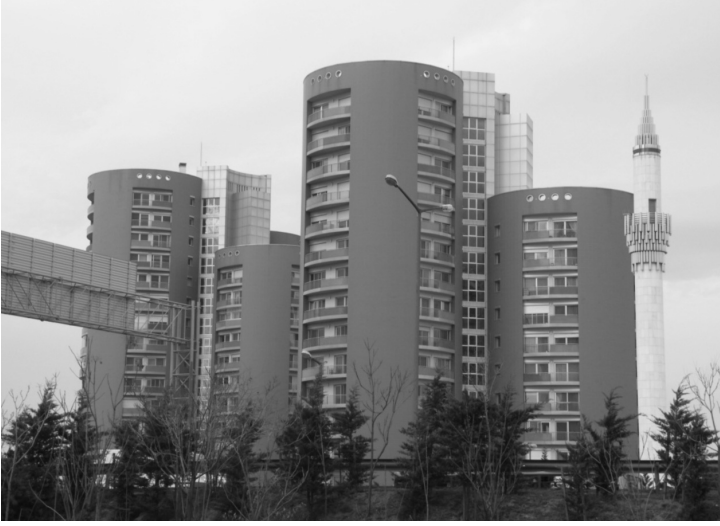
Fotoğraf 3: Sitenin esas tanımlayıcı unsuru olan ezici, yüksek bloklar ve sağ taraftaki küçük bir ayrıntı olarak görünen Yeşil Vadi Camii minaresi gündelik hayat ile dini kimlik arasındaki tersliğin mimari ifadesidir.

İstanbul Ümraniye’de “TEM otoyolu” 6 ile devlet ormanı arasındaki vadi üzerinde bulunan “Yeşil Vadi Konakları” Türkiye’deki ekonomik gelir seviyesi yüksek “seçkin” toplum kesimlerine hitap eden site yerleşmesidir. Yeşil Vadi Konakları’nın İstanbul’un diğer bölgelerinde bulunan orta halli sitelerinden farklı ve ayrıcalıklı özellikleri bulunmaktadır. Yeşil Vadi Konakları yerleşmesinin içinde eğitimden spora kadar çeşitli sosyal yaşam alanları vardır. Yeşil Vadi Konakları yerleşmesi projenin mimarı tarafından “yerleşme kuzey batedan ormanla, güneydoğu yönünden TEM karayolu kavşağı ile çevrelenmiş, tek kontrollü giriş yolu ile ulaşılan, çevresinde kötü bir gelişme olmasına olanak vermeyen bir kentsel vaha” olarak tanımlanmaktadır. 7 Gerçekten de site içinde güvenlik görevlilerinden habersiz kuş uçuşması dahi mümkün değildir. Diğer bir deyişle site içinde cami de belli bir ayrışmayı belirtmektedir. Yeşil Vadi Konakları olarak adlandırılan yerleşme içinde tek tip apartman ve daireler bulunmamak-