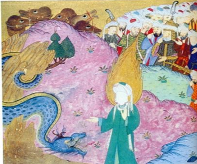
Resim-9. Hz. Muhammed kervan yolunu kesen ejderha ile konuşuyor, Siyer-i Nebi, 1594-95 (TSMK. H. 1222).