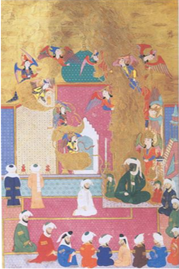
Resim-12. Hz. Muhammed Mi'râc yolculuđu, Mescidü'l Aksâ, Zübdetü't- Tevârih, 1583, (TİEM, 1973, y. 46a.)