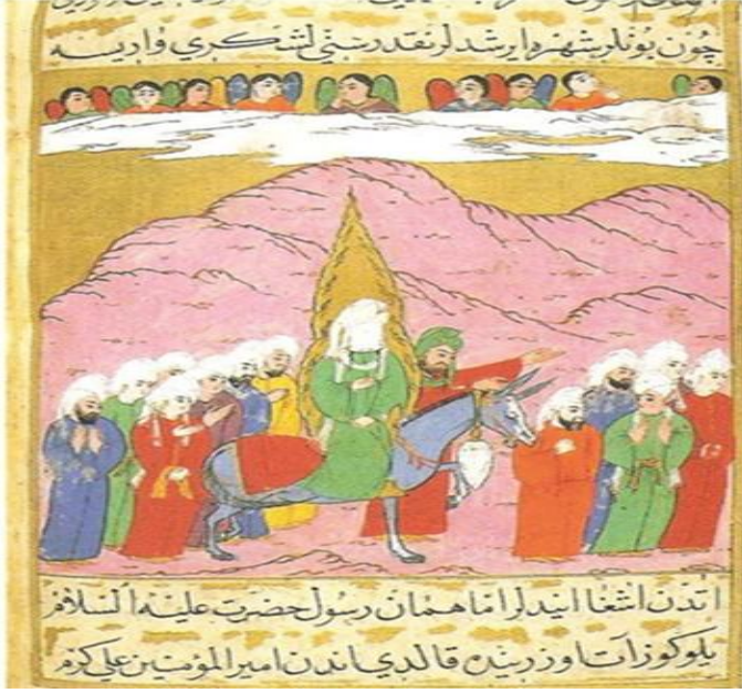
Resim-8. Mekke'nin Fethine giden Hz. Muhammed ve ordusu, Darir, (Siyer-i Nebi, 1594-95, TSM, H. 1223, y. 298a)