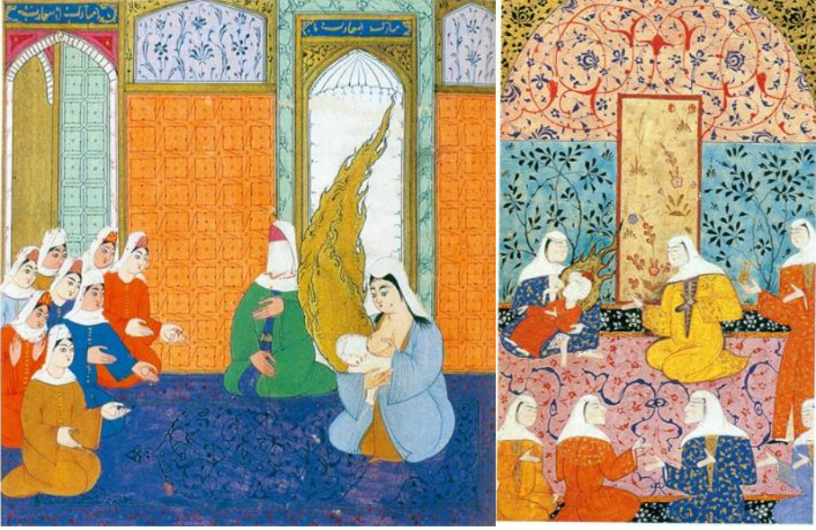
Resim-5. Süt annesi Halime'nin Hz. Muhammed'i emzirmesi, Darir, Siyer-i Nebi, 1594-95, (TSMK. H. 1221).