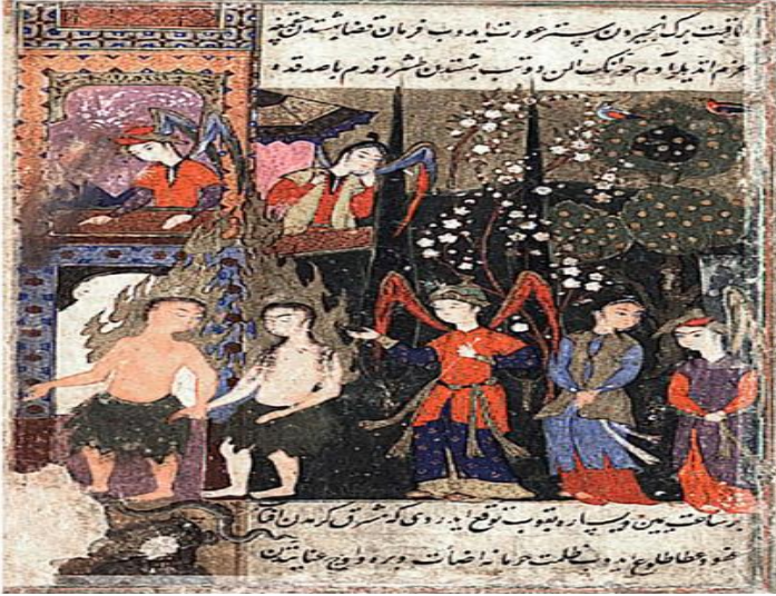
Resim-1. Hz. Adem ve Hz. Havanın Cennetten Kovulması, Hadikatü's-süeda, 1594, (SK, Fatih 4321, y.9a)