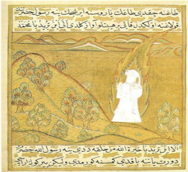
Resim-7. Hz. Muhammed'in Hira Dağın'da Allahtan vahiy alması, Darir, (Siyer-i Nebi, 1594-95, TSM, H. 1222, y.155a).