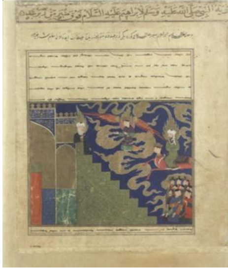
Resim-10. Hz. Muhammed'in Mirac'ta Hz. İbrahim ile Buluşması, Miracnâme, (TSM No: 2154 y. 119a.)