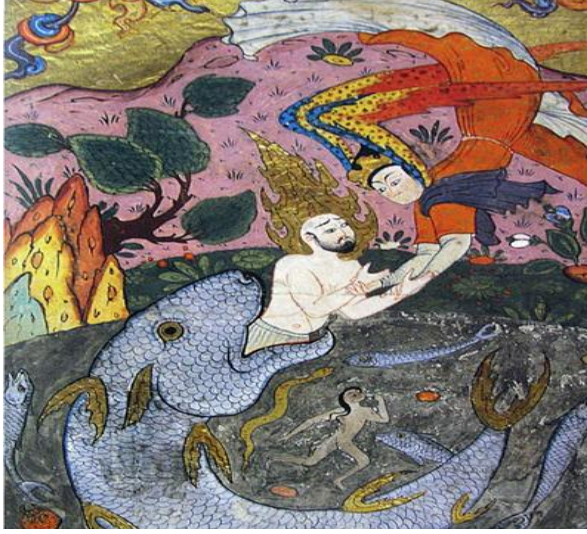
Resim-3. Hz. Cebrail, Hz. Yunus Peygamberi Balığın Karnından Çıkartıyor, Falname, y.1610, (TSMK, H. 1703).