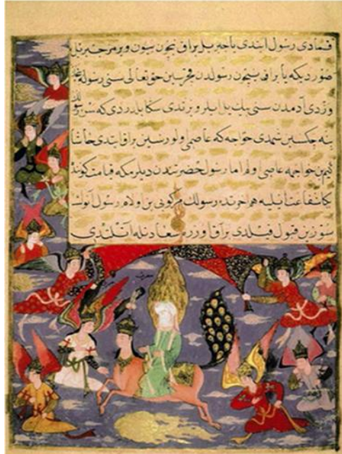
Resim-11. Hz. Muhammed'in Mirac yolculuğu, Siyer-i Nebi, 1594-95, (NYPL, y.5a.)