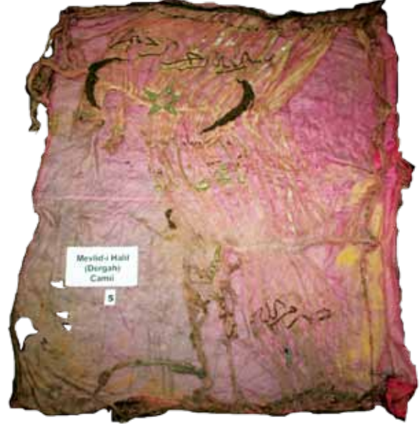
Fotoğraf 9. IV Nolu sancağın konservasyon öncesi durumu.

yönleri birbirine dönük, bakır tela ile iki adet hilal motifi işlenmiştir. İki hilalin ortasında da gümüş tela ile işlenen yıldız motifi yer almaktadır. Hilal ve yıldızın altında da hatları gümüş, harekeleri bakır teladan, 'Şüphesiz biz sana