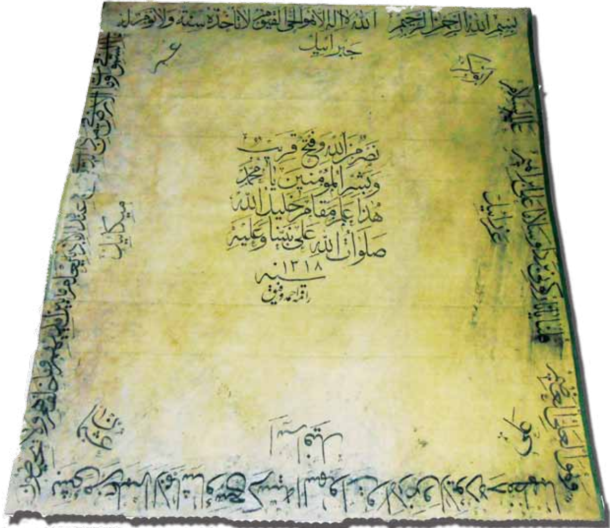
Fotoğraf 26. XII Nolu sancağın konservasyon sonrası durumu.