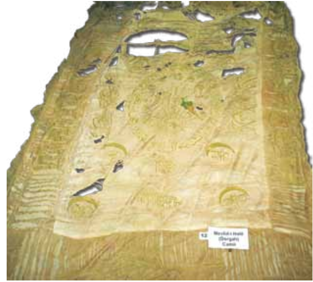
Fotoğraf 23. XI Nolu sancağın konservasyon öncesi durumu (Fot. S. Kardeşlik).

minin sol kenarında 'Levlake levlake lemma halaktul eflak-Sen (Muhammed) olmasaydın, Ben alemi yaratmazdım.' Hadis-i Şerifi, ana zeminin sağ kenarında da 'Ve inneke le'ala hulukin azim- Şüphesiz sen (Muhammed) üstün bir fazilet ve ahlaka sahipsin.' anlamındaki Kalem sûresinin 4. âyeti işlenmiştir. Ana zeminin tam orta kısmında tuğralı 'Tanzimat Arması' işlenmiştir. Armanın etrafında oval olarak işlenmiş hat yazıda, 'II. Abdülhamid Han' dan övgüyle söz eden bir kıta Farsça kaside yer almaktadır. Arma kompozisyonunun altında sağ ve solda 'Azrail' ve 'İsrafil' meleklerin isimleri işlenmiştir. Melek isimlerinin altındaki tek satırlık hatta, 'Urfa cenahu efradı yeminle salik Enbiya İbrahim Halilullah hazretlerine yadigarlarıdır.' ibaresi yer almaktadır. Bu cümlenin hemen altında, 'sene 1319' (1901) tarihi işlenmiştir. Ana zeminin en alt sağ ve solunda ise 'Ali' ve 'Hüseyn' isimleri yer almaktadır.