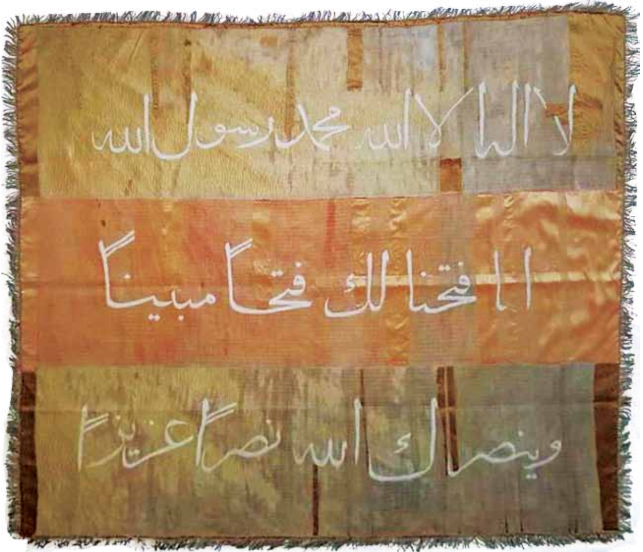
Fotoğraf 14. VI Nolu sancağın konservasyon sonrası durumu.