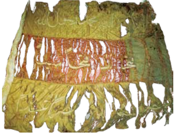
Fotoğraf 13. VI Nolu sancağın konservasyon öncesi durumu (Fot. S. Kardeşlik).

da, 'İnna fetehna leke fethan mübina-şüphesiz Biz, sana apaçık bir fetih başladık ' mealindeki Fetih sûresinin 1. âyeti işlenmiştir. Son satırda ise, ' Veyensurukallahu nesren eziza-ve Allah, şanlı bir zafer ile sana yardım eder .' mealindeki Fetih sûresinin 3. âyeti işlenmiştir. Üzerinde tarih işlenmemiş sancağı, erken 19. yüzyıla tarihlendirmek mümkündür. Sancağın kenarları kendi kumaş renginde saçak püsküllüdür.