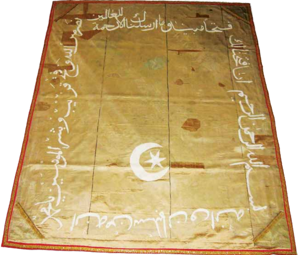
Fotoğraf 16. VII Nolu sancağın konservasyon sonrası durumu.