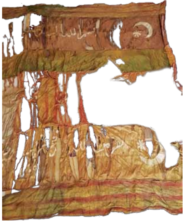
Fotoğraf 21. X Nolu sancağın konservasyon öncesi durumu.

Krem, kahve ve yeşil renklerde 4 ayrı parça ipek atlas kumaştan dokunmuş olan sancağın dört kenarında kutnu cinsi kumaş ile bordür oluşturulmuştur. Âyet ve işlemler ise beyaz saten kumaş ile dikilerek işlenmiştir. Sancağın sağ üst ve sol üst köşelerinde ikişer ay-yıldız , sağ orta kısımda ise Hz. Ali'nin kılıcı olan 'Zülfikar' motifleri yer almaktadır. Üstte ilk satırda 'Besmele' , ikinci satırda 'Kelime-i Tevhid' , üçüncü satırda ise, 'Nesrün minellahi ve fethün qaribun – Allah'ın yardımıyla fetih yakındır.' mealindeki Saff sûresinin 13. âyeti ve devamında, 'Seyyidina İbrahimen xelila–Allah dostu İbrahim, bizim efendimizdir.' manasında bir tamlama işlenmiştir. En altta, 'sene 1305' (1887) tarihi düşülmüştür.