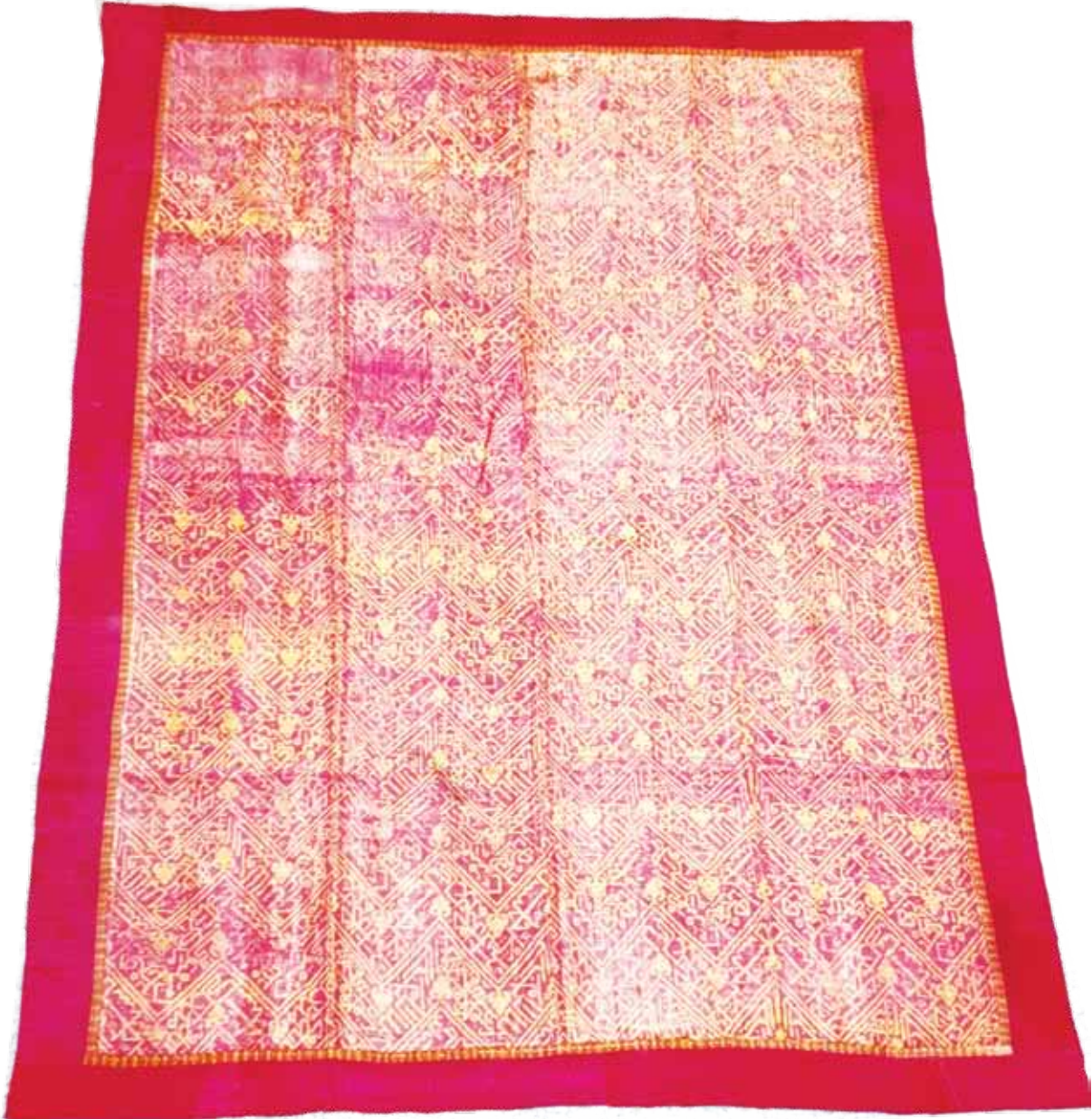
Fotoğraf 3. I Nolu sancağın konservasyon sonrası durumu (Fot. S. Kardeşlik).