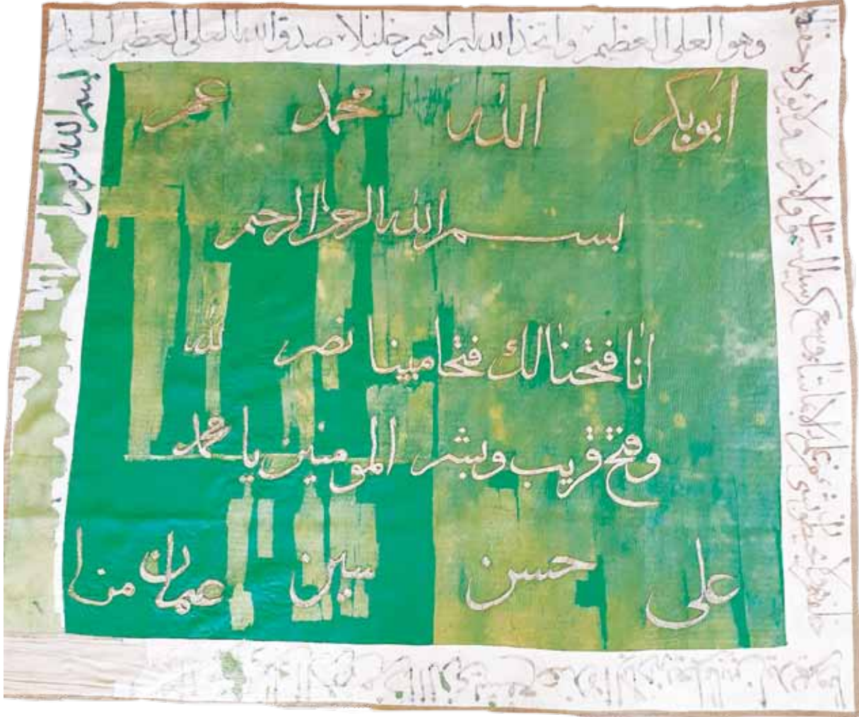
Fotoğraf 8. III Nolu sancağın konservasyon sonrası durumu.