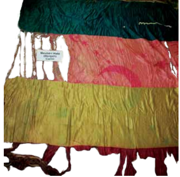
Fotoğraf 11. V Nolu sancağın konservasyon öncesi durumu.

löp yok olmuş hat ile işlemelerin kumaş yüzeyindeki izlerinden anlaşılmaktadır. Sancağın pembe zeminli kısmında, küçük ve büyük çok sayıda hilal ve yıldız motiflerinin işlendiği, zemindeki izlerden tespit edilebilmektedir. Yine pembe zeminli alanda, 'Padişahım çok yaşa' ibaresi okunabilmektedir. Kırmızı renk zeminli alanda ise çok sayıda