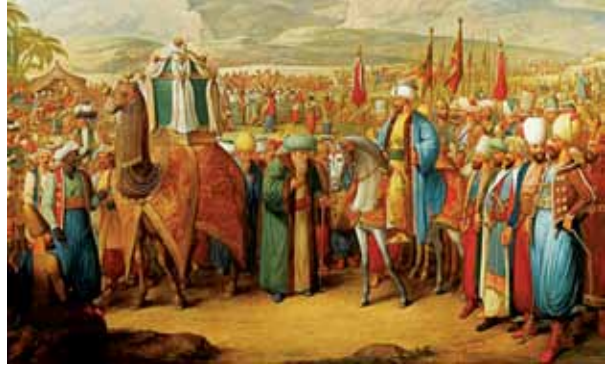
Resim 1. Osmanlı dönemi Surre Alayı (Surre-i Hümayun) töreni.

Bu kadim ve kutsal şehirde, Hz. İbrahim Peygamberin doğduğuna inanılan makam mağarasının yer aldığı ve en önemli Kadiri tarikatı şeylerinden Seyyid Şeyh Dede Osman (vefat 1883) Hazretleri türbesinin de bulunduğu Dergâh (Mevlid-i Halil) Külliyesi, en çok ziyaretçi çeken yer olarak Şanlıurfa'nın gözbebeği konumundadır (Karakaş 2017:119-132). Şanlıurfa'nın, Anadolu'dan Hicaz'a giden yol kavşağında olması ve Hz. İbrahim Peygamber makamını nedeniyle, son bin yıl boyunca kullanılan 'Urfa-Halep' Hac güzergâhı, Şanlıurfa'nın inanç turizmi ve kültürüne katkıda bulunmuştur. Dolayısıyla Anadolu'dan toplanıp, Hicaz'a giden hacı kabilelerinin Anadolu'daki son çıkış kapısının Şanlıurfa olduğu ve Osmanlı tarihi boyunca Surre