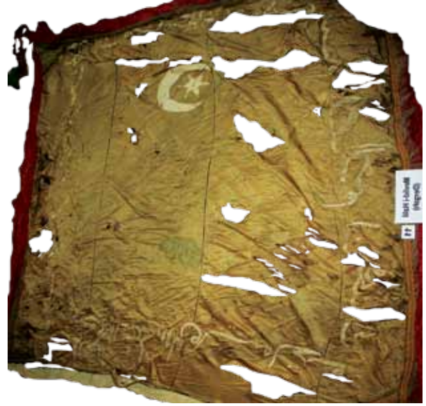
Fotoğraf 15. VII Nolu sancağın konservasyon öncesi durumu (Fot. S. Kardeşlik).

yardımıyla gelen fetih zaferini müminlere müjdele.' anlamındadır. Sancağın üzerine işleniş ay-yıldız motifinin bayrak ve sancaklarımızdaki ortaya çıkışı göz önünde bulundurulursa tarih düşülmemiş sancağı, 19. yüzyılın ikinci yarısına tarihlemek mümkündür.