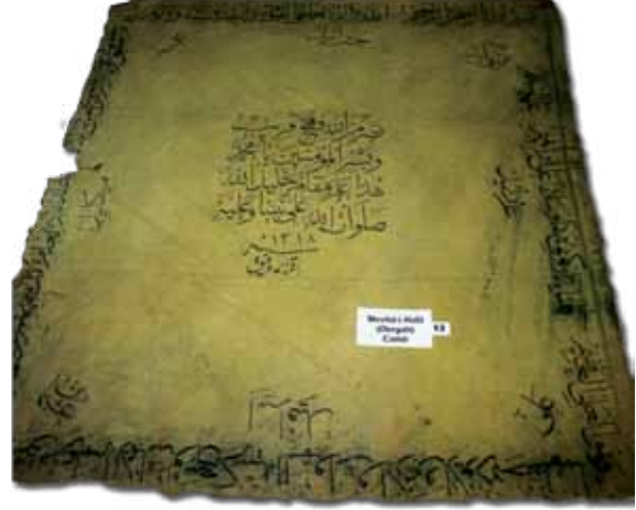
Fotoğraf 25. XII Nolu sancağın konservasyon öncesi durumu.

Sağ alt kenarda 'Ali' , ortada 'İsrafil' , sol alt kenarda da 'Osman' ismi yer almaktadır. Sancak zemininin tam ortasında ise, 'Nesriün minellahi ve fethün qaribün ve beşşiril müminine Ya Muhammed–Ey Muhammed! Allah'ın yardımıyla gelen fetih zaferini müminlere müjdele.' mealindeki Saff sûresinin 13. âyeti işlenmiştir. Devamında, 'Âleme mekamî Halilüllah selevatullahi âla nebiyyina vealeyhi' yazılıdır. Orta kısımdaki kitâbenin altında, 'Sene 1318 (1900) rakeme Ahmet Vefik' yer alır.