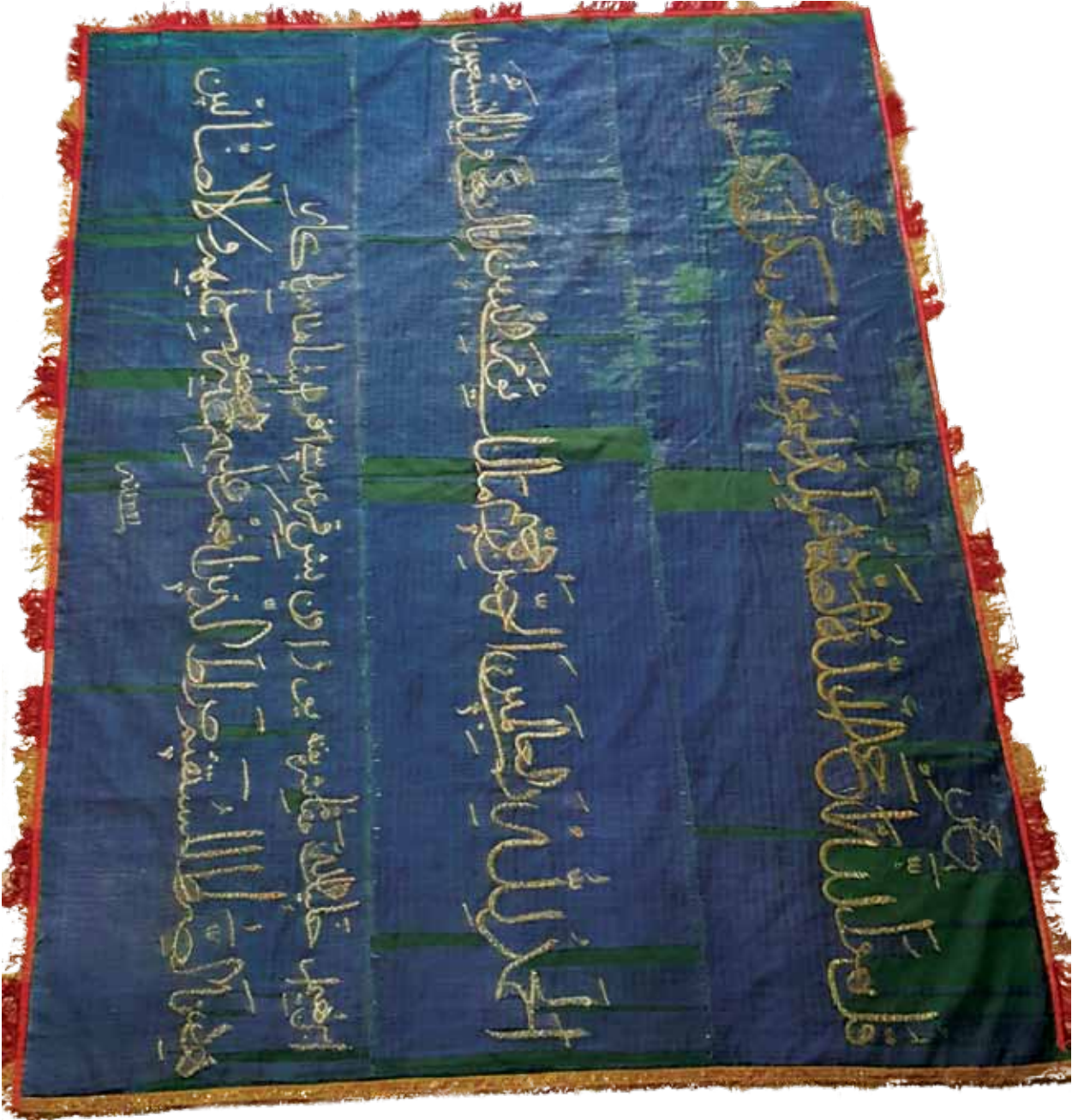
Fotoğraf 20. IX Nolu sancağın konservasyon sonrası durumu (Fot. S. Kardeşlik).

almaktadır. İlk satırda 'Deki; Allah tektir. O, kimseye muhtaç değildir, her şey O'na muhtaçtır. O, doğmamış ve doğurmamıştır. Hiçbir şey O'na denk değildir.' mealindeki tüm İhlas sûresi işlenmiştir. İkinci ve son satırda, 'Hamd alemlerin Rabbi, Rahman ve Rahim olan, hesap ve ceza-mükafat gününün sahibi olan Allah'a mahsus-tur. Allah'ım! yalnız sana ibadet eder ve yalnız senden yardım dileriz. Bizi doğru yola, kendilerini mükafatlandırdıklarının yoluna ilet, cezalandırdıklarının yoluna değil.' mealindeki Fatiha sûresinin tümü işlenmiştir. Sancağın üçüncü satırında ise, 'İbrahim Halilullah makamı şerifine yüz on beş qer'esi efradı şahanesi yad egler.' En alt kısımda, 'sene 1321' (Miladi 1902) tarihi işlenmiştir. Üç tarafının saçağı sarı ve kırmızı ipek püsküllü olup, direk kısmına bağlanan saçağı ise altın sırma işlemelidir.