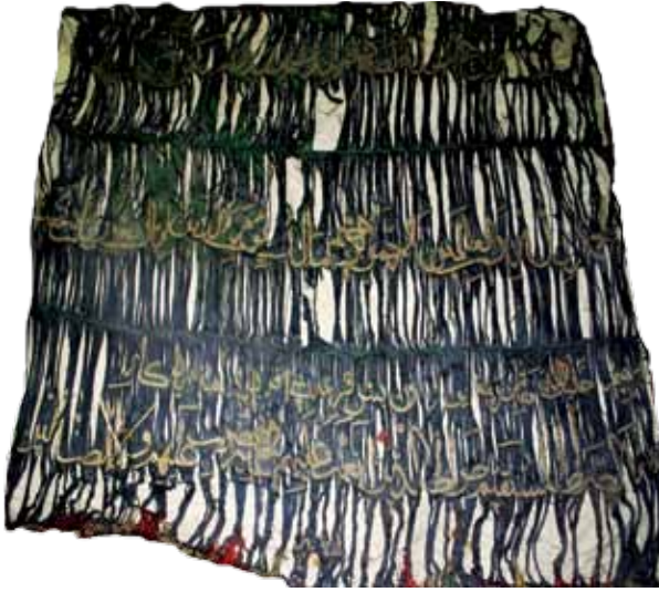
Fotoğraf 19. IX Nolu sancağın konservasyon öncesi durumu (Fot. S. Kardeşlik).

almaktadır. İlk satırda 'Deki; Allah tektir. O, kimseye muhtaç değildir, her şey O'na muhtaçtır. O, doğmamış ve doğurmamıştır. Hiçbir şey O'na denk değildir.' mealindeki tüm İhlas sûresi işlenmiştir. İkinci ve son satırda, 'Hamd alemlerin Rabbi, Rahman ve Rahim olan, hesap ve ceza-mükafat gününün sahibi olan Allah'a mahsus-tur. Allah'ım! yalnız sana ibadet eder ve yalnız senden yardım dileriz. Bizi doğru yola, kendilerini mükafatlandırdıklarının yoluna ilet, cezalandırdıklarının yoluna değil.' mealindeki Fatiha sûresinin tümü işlenmiştir. Sancağın üçüncü satırında ise, 'İbrahim Halilullah makamı şerifine yüz on beş qer'esi efradı şahanesi yad egler.' En alt kısımda, 'sene 1321' (Miladi 1902) tarihi işlenmiştir. Üç tarafının saçağı sarı ve kırmızı ipek püsküllü olup, direk kısmına bağlanan saçağı ise altın sırma işlemelidir.