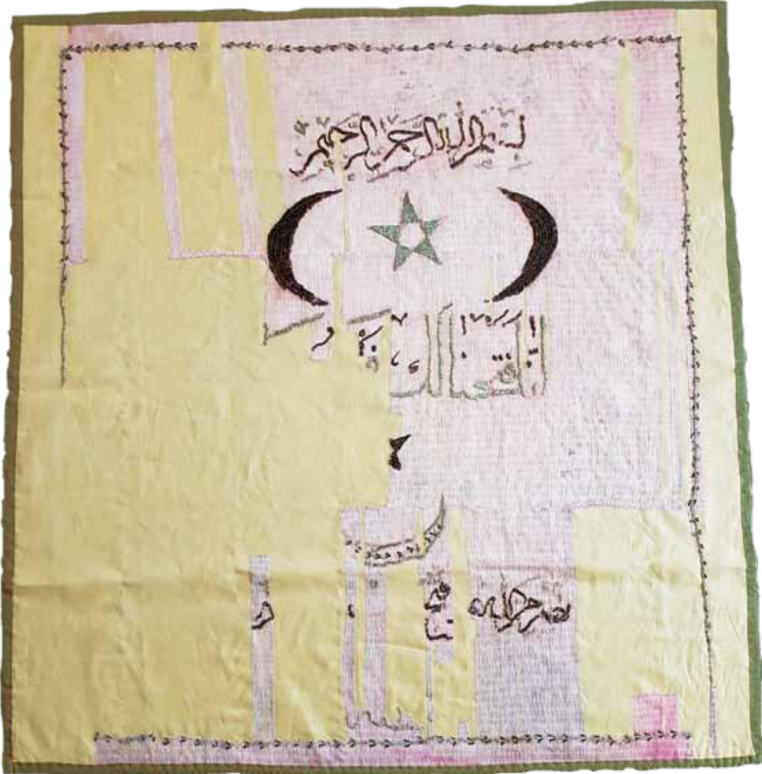
Fotoğraf 10. IV Nolu sancağın konservasyon sonrası durumu.