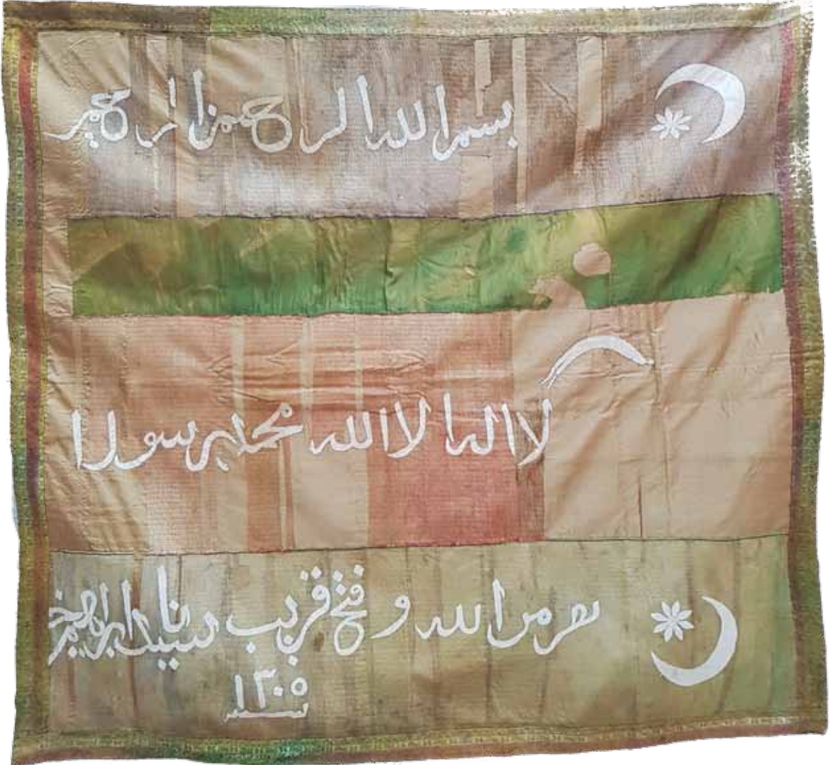
Fotoğraf 22. X Nolu sancağın konservasyon sonrası durumu (Fot. S. Kardeşlik).