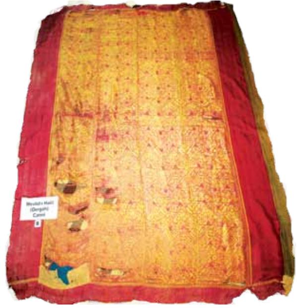
Fotoğraf 2. I Nolu sancağın konservasyon yapılmadan önceki hali.

Kâbe iç örtüsü olduğu düşünülmektedir. Çünkü Kâbe iç örtüleri, genellikle kutnu (atkısı pamuk, çözücü ipek olan) kumaş cinsinden dokunur ve ağırlıklı olarak kırmızı veya yeşil renktedirler. Kutnu kumaş, yaygın olarak Gaziantep, Şanlıurfa ve Halep'te dokunmaktadır. 175x135 cm ölçülerindeki eserin, 17 veya 18. yüzyıllarda dokunduğu düşünülmektedir. Bordürü sade kırmızı pamuk ve ipek karışımıdır. Bulduğu ortamın ısı ve nem gibi iklim koşulları nedeniyle renk solması ve tahribat gözlemlene-