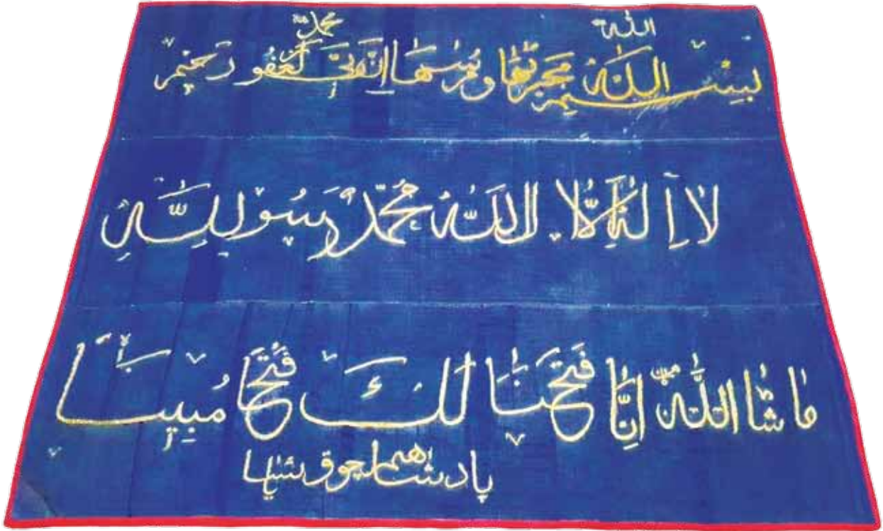
Fotoğraf 18. VIII Nolu sancağın konservasyon sonrası durumu.

Gemisi) gitmesi de durması da Allah'ın adıyladır, Rabbin çok bağışlayıcıdır. ' mealindeki Hud sûresinin 41. âyeti işlenmiştir. İkinci satırda, ' Kelime-i Tevhid-Allah'tan başka ilah yoktur, Muhammed Allah'ın resulüdür. ' yer almaktadır. Üçüncü satırda ise, ' Maşaallah, İna fetehna leke fetihen mübina-şüphesiz Biz, sana apaçık bir fetih müjdeledik. ' anlamında Fetih sûresinin 1. âyeti işlenmiştir. En alt satırda da diğer sancaklardan farklı bir uygulama olarak, ' Padişahım çok yaşa ' sözü işlenmiştir.