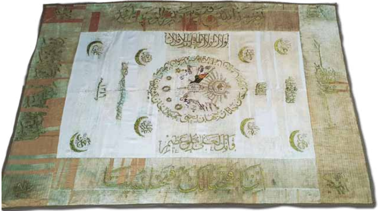
Fotoğraf 24. XI Nolu sancağın konservasyon sonrası durumu.