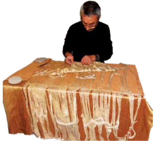
Fotoğraf 1. Sancak eserlerin konservasyon aşaması (Fot. S. Kardeşlik).

Osmanlı kumaşları, dokuma tekniği, malzeme özellikleri ve desen zenginlikleri ile dokuma sanatının evrimi içinde önemli bir yere sahiptir. Türk-İslam döneminin erken kumaş eserleri, günümüze pek ulaşmamış olsa da dönemin minyatür sanatında tasvir edilen örneklerle tanıyabilmekteyiz. Canlı renk ve süslemeleri ile dokuma ve kumaş eserler, Türk-İslam dokuma sanatının eşsiz ilk örneklerini sunmaktadır. İbn-i Batuta ve Marco Polo gibi seyyahlar, 13-14. yüzyıl Anadolu'sunun sanatsal dokuma ve kumaş eserlerinden övgüyle söz etmektedirler. Osmanlı döneminden günümüze kalabilen kumaş ve dokuma örneklerini, Topkapı Sarayı ve Mevlana Müzesi koleksiyonlarında görebilmekteyiz. Özellikle Konya Mevlana Müzesi'ndeki sancak eserler, bu alanda çok önemli bir koleksiyona sahiptir. Osmanlı dönemi kumaş tekniği, halk arasında dokunan kumaşlar (yöresel) ve saray tezgahlarında dokunan saray dokumaları olarak iki yönde gelişim göstermiştir (Sözen 1998:192). Osmanlı İmparatorluğu döneminde, altın ve gümüş tellerle dokunmuş ipek kumaşlar, dönemin saray hayatı ve manevi önem taşıyan alanlarda, törenlerde sıkça yer tutmuştur. İpek kumaş ticaretinin, 16 ve 17. yüzyıllarda Osmanlı devlet hazinesinin en büyük gelirleri arasında olduğu bilinmektedir (Gürsu 1988:17-18). Bu açıdan Şanlıurfa, kuşkusuz ipek ticareti kervan yolu üzerinde önemli bir şehirdir (İnalçık 2008:232).