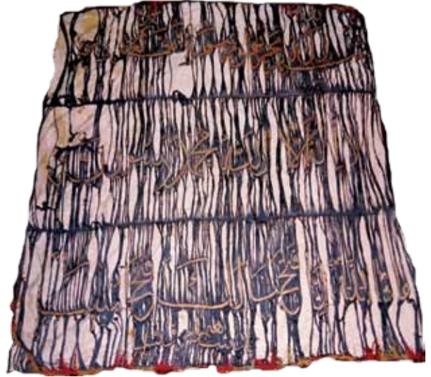
Fotoğraf 17. VIII Nolu sancağın konservasyon öncesi durumu.

Açık lacivert renk ipek-saten karışımı kumaş üzerine altın ve gümüş karışımı (elektron) telalar ile tel kırma tekniğinde hatlar işlenmiştir. Eserin en üst sağ tarafında 'Allah' lafzı, solda 'Muhammed (s.a.v.)' ismi işlenmiştir. Üst sağdan başlanarak ilk satırda, ' Bismillahi mecraha ve mürsaha inne Rabbi legafururrahim-Onun (Nuh'un