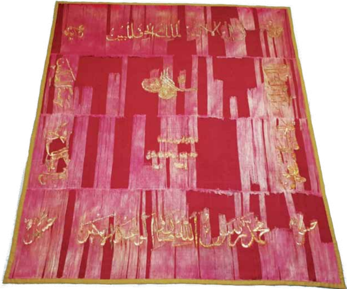
Fotoğraf 6. II Nolu sancağın konservasyon sonrası durumu.