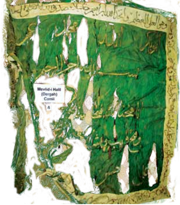
Fotoğraf 7. III Nolu sancağın konservasyon öncesi durumu.

isimleri işlenmiştir. Eserin zemin ortasında, 'Bismillahir-rehmanirrehim, inna fethna leke fethen mübina, nesrün minallahi ve fethun qaribun ve beşşiril' müminine ya Muhammed-Rahman ve Rahim olan Allah'ın adıyla, şüphesiz