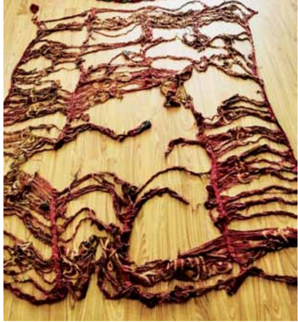
Fotoğraf 5. II Nolu sancağın konservasyonu yapılmadan önceki hali.

'Ya ilahel alemin ve ya hayran nasirin- Dualarımızı kabul eyle Ey alemlerin Rabi ve yardım edip koruyanların en hayırlısı.' duası işlenmiştir. Ortada sol kenarda ise, 'Vema erselnake illa rahmeten lil alemin-Biz, seni alemlere rahmet olarak gönderdik.' Enbiya sûresinin 107. âyeti işlenmiştir.