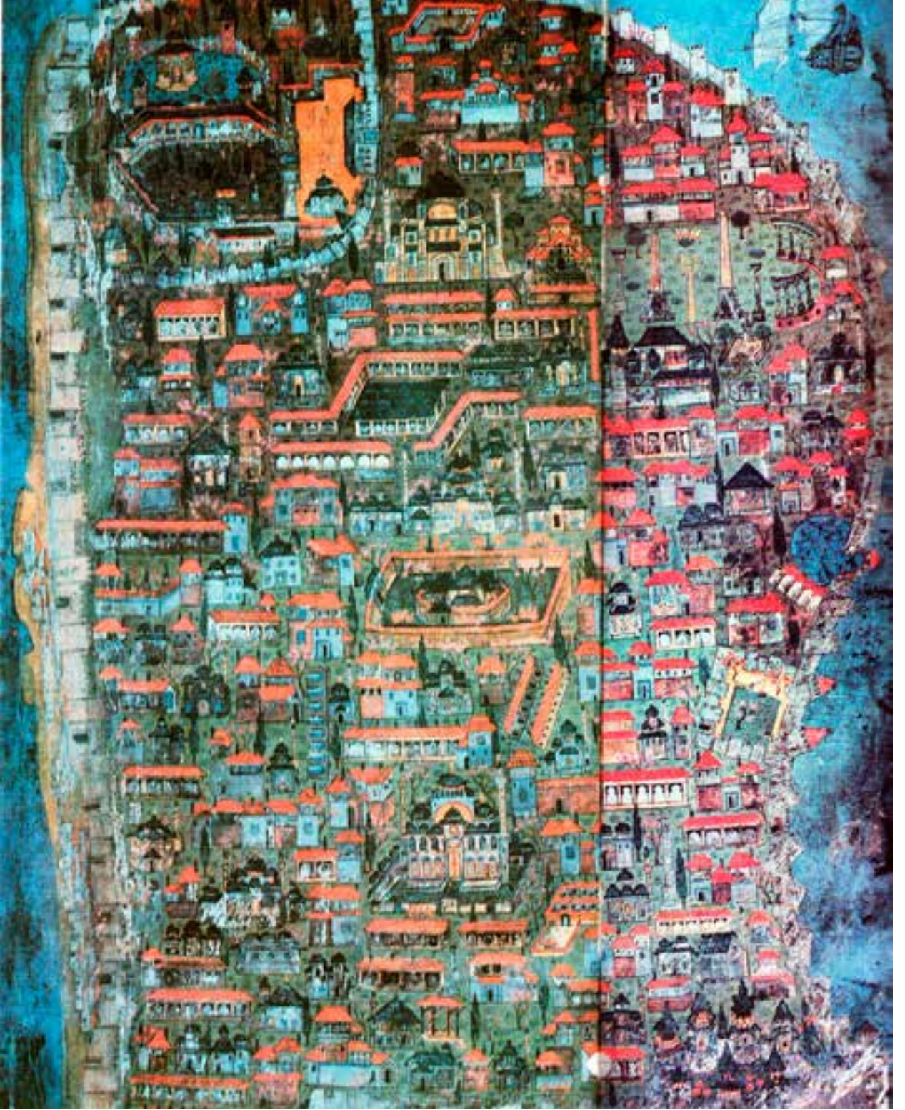
Fotoğraf 1. Matrakçı Nasuh'un minyatür tekniği ile yapılmış İstanbul planında İlk Fatih Camii (1537).

merler ve sarnıçlar inşa ettirilmiştir. İmparator Valentianus tarafından Valens Kemer (Bozdoğan), I.Theodisius zamanında da şehir batıya doğru geliştikçe şimdiki Bayezid Meydanı'nda ve ana yol mese üzerinde, dış yüzeyleri bitki kabartmalı büyük Zafer Takı inşa edilmişti.