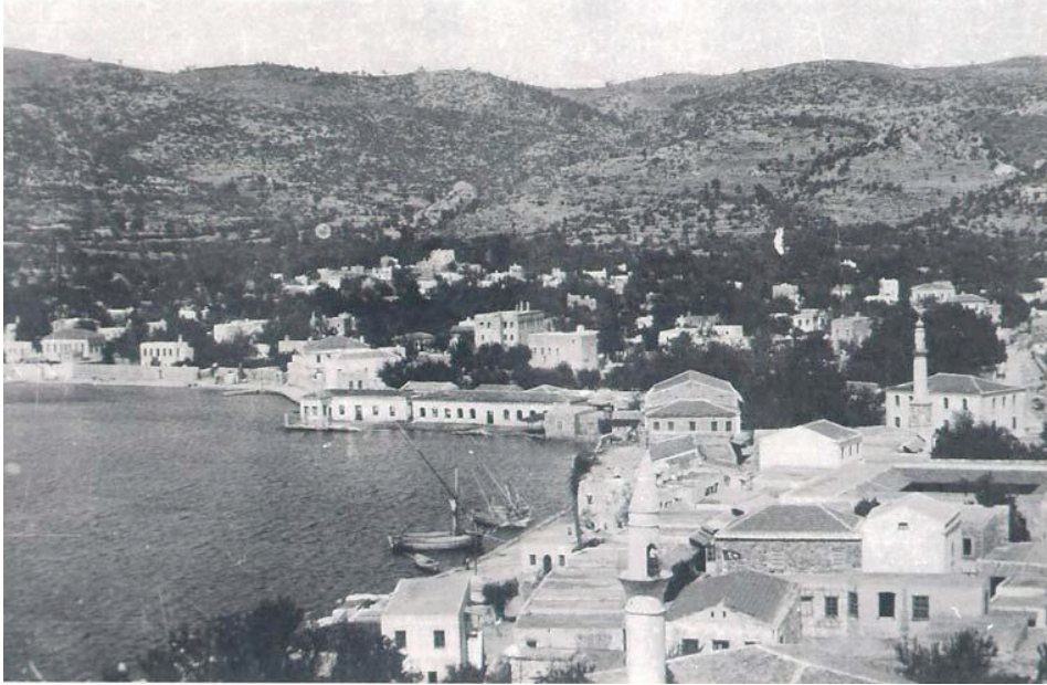
Resim 2. Adliye Camiinin genel görünüşü (1930'lar)