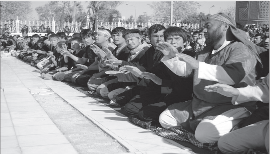
Hz. Ali türbesinin içinde dizleri üzerinde oturan sinezenler

Mezar-i Şerifteki bütün camilerin Desteleri Hz. Ali'nin türbesine geldikten sonra Aşura merasimi başlamış olur. İlk önce bir hoca Aşura olayıyla ilgili konuşmalar yapar. Aşura'nın öneminden bahseder. Daha sonra bütün Deste üyeleri dizlerin üzerinde oturarak arka arkaya saf tutarlar (Mohammad Hoseyin, 20.07.2015, Mezar-i Şerif/Afganistan).