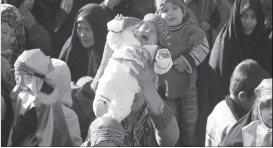
Ali Asger'i temsilen küçük bir bebek

Aşura gününde Hz. Hüseyin'in 6 aylık bebeği Ali Asger de şehit olmuştur. Ali Asger'i temsilen bebeği olanların kendi bebeklerini beyaz kundağın içinde başını "Ya Ali Asger" yazılı yeşil bir bezle bağlayıp merasime getirirler (Ahund Mohammad Ali, 20.07.2015, Mezar-i Şerif/Afganistan).