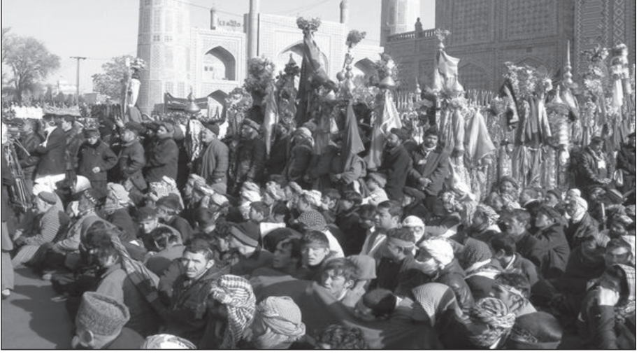
Bütün Alamların toplandığı yerden bir görünüm

ler. Hz. Ali'nin türbesinin avlusunda bütün Alamlar bir yerde toplanır. Alam'ı getiren kişi, Alam'ın yanından ayrılmaz ve merasimin sonuna kadar Alam'ın yanında durur (Ahund Afkari, 20.07.2015, Mezar-i Şerif/Afganistan).