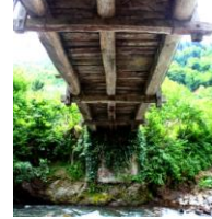
Foto. 6. Malakmiyet Köprüsü tabliye altı - güneybatı yaka