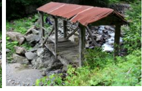
Foto. 23. Baltacılar Köprüsü kuzeybatı girişi