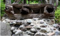
Foto. 27. Baltacılar Köprüsü güneydoğu girişi ayrıntısı