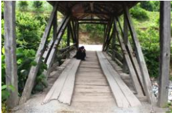
Foto. 7. Malakmiyet Köprüsü tabliyesi - kuzeydoğudan