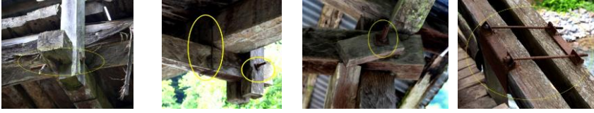
Foto. 17-20. Malakmiyet Köprüsü'nde vida ve demir kenetli metal bağlantı ayrıntıları