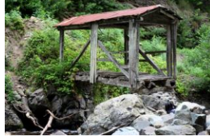
Foto. 25. Baltacılar Köprüsü mansab yüzü - güneyden