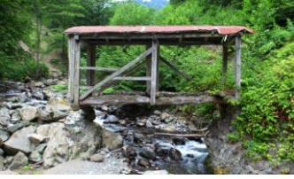
Foto. 24. Düzenli Köyü Baltacılar Köprüsü menba yüzü