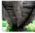
Foto. 28. Baltacılar Köprüsü tabliye altı