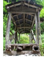
Foto. 26. Baltacılar Köprüsü güneydoğu girişi