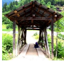
Foto. 5. Malakmiyet Köprüsü güneybatı girişi