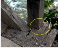
Foto. 10-11. Malakmiyet Köprüsü'nde "kertmeli uç birleştirme" ayrıntıları