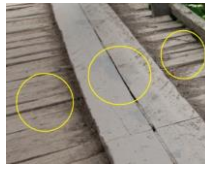
Foto. 8-9. Malakmiyet Köprüsü'nde "düz en birleştirme" (ortada), "düz boy birleştirme" (sağda)