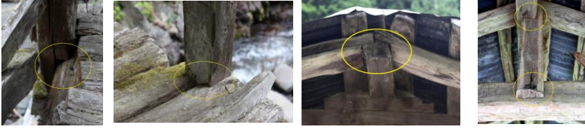
Foto. 32-35. Baltacılar Kprs “kertmeli uç birleřtirme” ayrıntıları