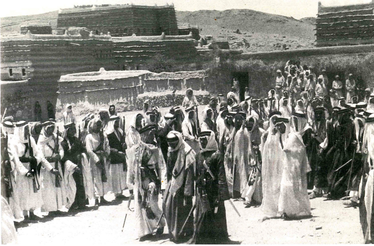
1921'de Suud'da Abha yakınlarında bir pazarda Suudiler

Müşrikler putların kendileri için şefaathçi olacağını iddia etmiştir. Şefaath Allah'a aittir. Hz. Peygamber (s.a.v.) Allah'ın izniyle günahkar müminler için şefaathçi olacaktır. Allah ile kul arasına araçlar koyup vesile edinmek, tevessülde bulunmak, türbe ziyaretinde kabirde yatan peygamberden veya salih kuldan yardım istemek anlamında istimdatta bulunmak insanı küfre düşürür. Hz. Peygamber (s.a.v.)'in doğumunun kutlanması, mevlid programları dine sonradan sokulmuş bidat kabul edilir. İmamları ve onların türbelerine yapılan ziyaretleri kutsal gören Şiiler, kendilerine has ayinleri olan tarikatlar ve mütekellimler Vehhabilerin eleştirilerine hedef olmaktadır. müminlere dost olmak (el-velâ) ve imansızlar ve ehl-i bidat olanlardan uzak durmak (el-berâ) Vehhabilerin ilişkilerine yön verir.