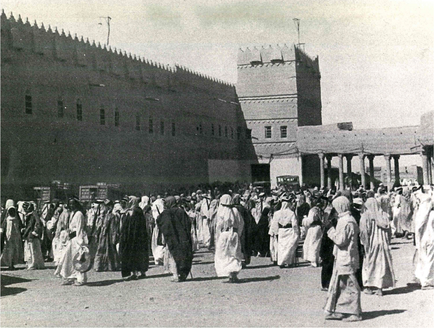
1900'lerin başında Riyad'da eski sarayın etrafı

baskın düzenleyip kuruluş dönemindeki Necd İhvan'ın görüşlerine dönülmesini istediler ancak isyanları bastırıldı. Suûdi yönetimi Afganistan'da Sovyetlere karşı yapılan cihada (1979-1989) maddi ve insan gücü desteği sağladı. Burada tecrübe kazanan Selefi gruplar içerisinde, menheçleri ve öncelikleri farklı olan el-Kaide ve onun içinden Dâiş terör örgütü ortaya çıktı.