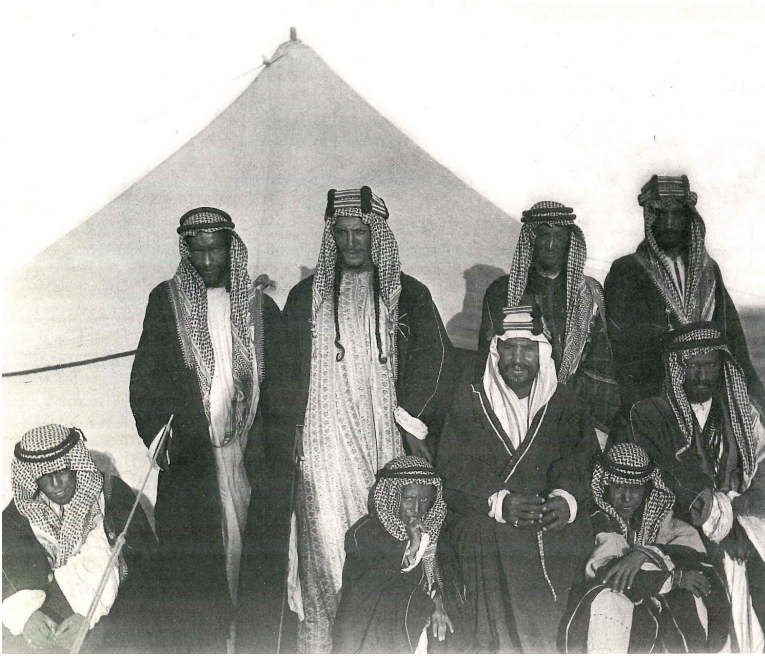
İbn Suud kardeşleri ve oğullarıyla bir çadır önünde

Şeyhülislam tarafından 1205/1790 yılında 18 Sultan III. Selim'e (1789-1807) Muhammed b. Abdilvehhab'ın itikadda Eş'ari, amelde Hanbeli olduğu, Vehhabiler'in Mekke şeriflerini Zeydi oldukları için tekfir ettikleri bilgisi verilmiştir. 19 Şam Valisi Cezzâr Ahmed Paşa 17 Ekim 1793 tarihinde Vehhabi tehlikesinin vahim olduğunu bildirmiştir. 20