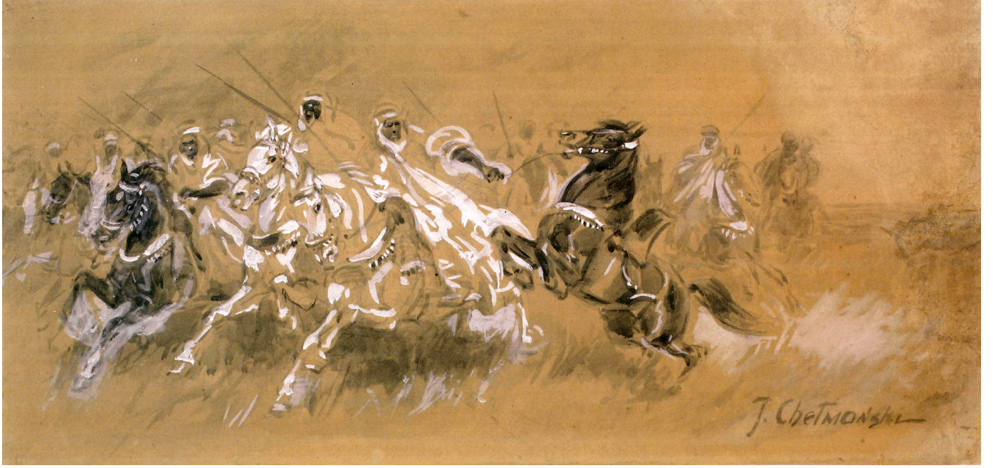
Polonyalı ressam Jozef Chelmonski'ye ait Arap süvarilerini hücum esnasında resmeden bir tablo için hazırlanan eskizi. Tarih 1884-1886?

evlenmiştir. Etrafındaki Vehhabiler ile Hz. Ömer'in kardeşi Zeyd b. el-Hattâb'ın (v. 12/633) türbesini yıkmıştır. Zeyd yalancı peygamber Müseylime ile savaşta şehit düşmüştü. Türbesi hacca giden kabileler tarafından ziyaret ediliyordu. 8 Bunun üzerine Benî Hâlid'den Ahsa emiri Süleyman (1731-1753), emir Osman'dan Muhammed b. Abdilvehhab'ı öldürmesini veya bölgeden uzaklaştırmasını istemiştir. 9