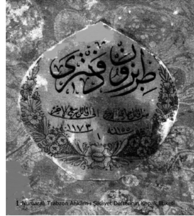
1 Numaralı Trabzon Ahkâm-ı Şikâyet Defterinin Kapak Etiket