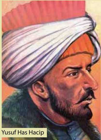
Yusuf Has Hacip

Nitekim Fuzûli’den yaklaşık yetmiş yıl sonra vefat eden divan edebiyatının kadı şairlerinden Veysi, ahlâksızlığın, fık u fücûrun alıp yürüdüğünü, rüşvet ve cehâletin yaygınlaştığını, adam kayırmamanın sıradan bir iş haline geldiğini, emanetin ehline tevdi edilmediğini anlattığı bir şikâyetnâmesinde ferdî ve ictimâî tefessühe adalet yoksunluğunun ve kadıların şahsî menfaatlerini