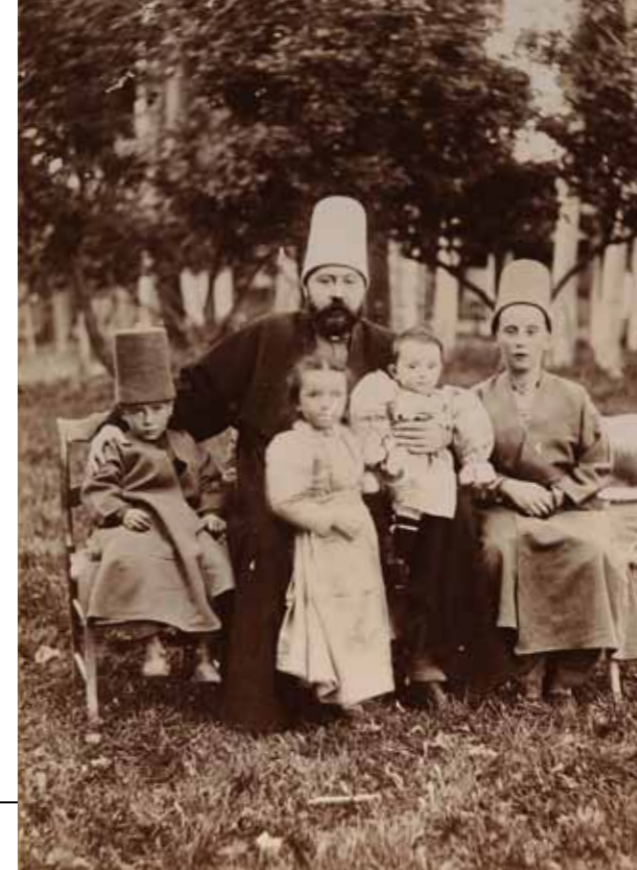
1900'lerin başından bir kare