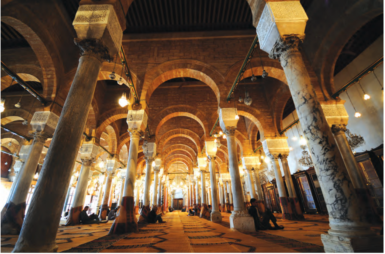
Tunus'ta bir camii

eğitimlerle yine de din hizmetlerini karşılayacak sayıda görevli yetişmemektedir. Son yıllarda Mali, Nijerya, Fildişi Sahili, Ruanda gibi pek çok ülkede açılan İslâm Enstitülerinde yeni nesil imamlar eğitilmektedir. Bu anlamda Cezayir'deki Dâru'l-İmâm isimli kurum imamlara yüksek eğitim vermektedir. Zaten Mısır'da Ezher, Tunus'ta Zeytûne ve Fas'ta Karaviyyîn gibi köklü eğitim kurumları yanında Cezayir'deki Emir Abdülkadir Üniversitesi gibi