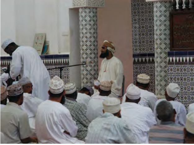
Tanzanyalı bir imam vaazda

Kuveyt, Birleşik Arap Emirlikleri, Mısır, Sudan ve İran gibi ülkeler Afrika Müslüman toplumlarıyla yakından ilgilenmektedirler. Suudi Arabistan daha ziyade Rabıta (World Islamic League) teşkilatı vasıtasıyla Afrika Müslüman toplumlarına yardım eli uzatırken, Libya Uluslararası Çağrı Teşkilatı (The World Islamic Call), Kuveyt Afrika Müslüman Ajansı (African Muslim Agency-AMA) ve İran ise Afrika ülkeleri başkentlerine kurduğu kültür merkezleriyle yoğun bir faaliyet içindedir. Sahra-altı bölgesindeki toplumlarla ilgili başta eğitim olmak üzere, sağlık ve kültür alanlarında ciddi destek sağlamaktadırlar. Ayrıca İslâm Konferansı Teşkilatı Nijer'in Say şehrinde ve Uganda'nın Mbale şehrinde açtığı iki üniversite ile bölge ülkelerinden gelen gençlere yüksek eğitim imkânı sağlamaktadır. Yine Sudan'da ve Libya'da özellikle Afrikalı Müslüman gençlere yüksek eğitim imkânı sağlayan birer İslâm Üniversitesi bulunmaktadır.