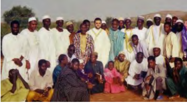
Mali'de Ulusal İmamlar Toplantısı