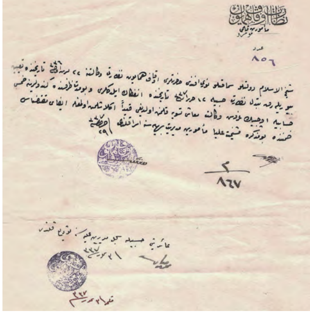
Belge 1: Şeyhülislâm Mehmet Nuri Medenî Efendi'nin Evkâf-ı Hümâyûn Nezâreti'ne vekâleten tayinini ve kendisine ödenen vekâlet maaşını gösterir belge.

Şeyhülislâm olmuştur. 2 Kabinenin istifası üzerine 21 Ekim 1920'de Şeyhülislâmlık'tan ayrılmışsa da 27 Eylül 1920 tarihli Hatt-ı Hümâyûn mücebince 4 Kasım 1920'de kurulan yeni hükümetle birlikte ikinci defa Şeyhülislâmlık makamına gelmiştir. 23 Ekim 1920-13 Haziran 1921 tarihleri arasında Evkâf-ı Hümâyûn Nezâreti vekâletinde de bulunmuştur.