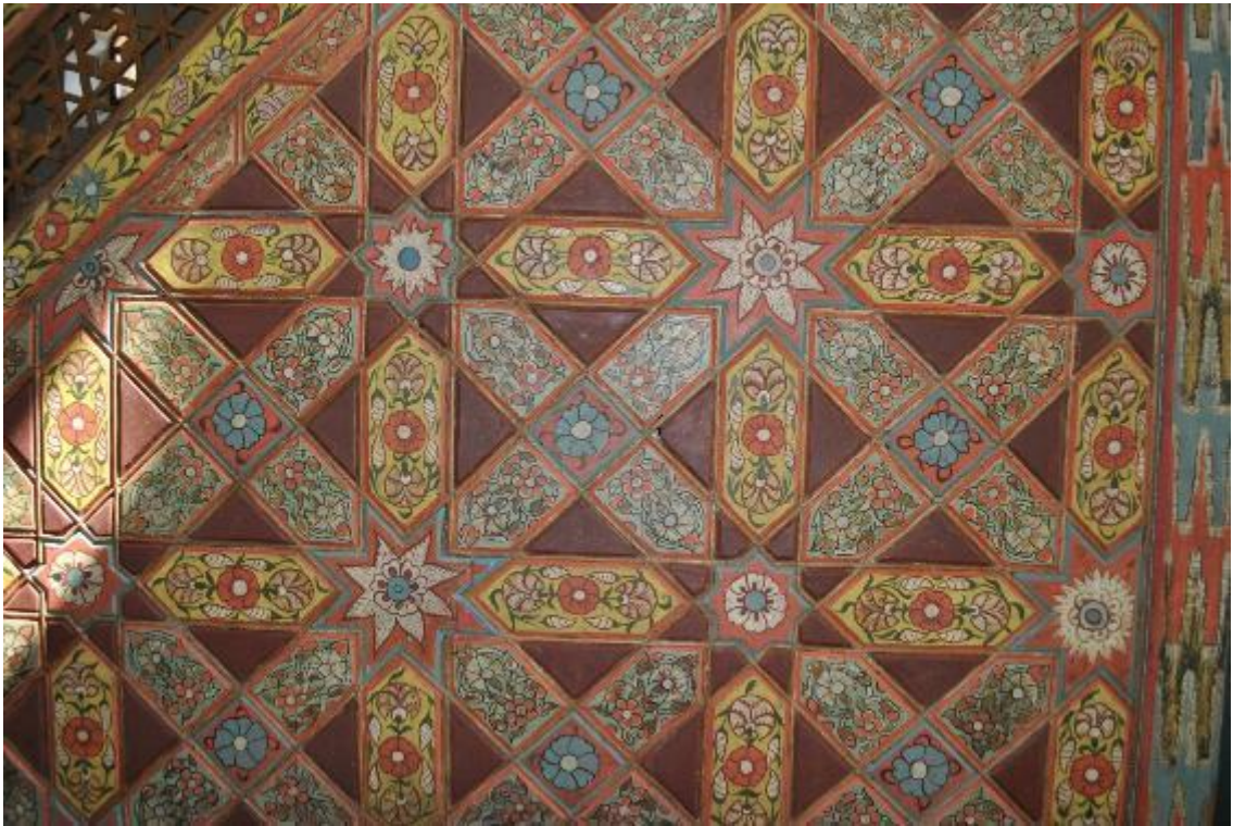
Resim 30: Batı cephe (detay)