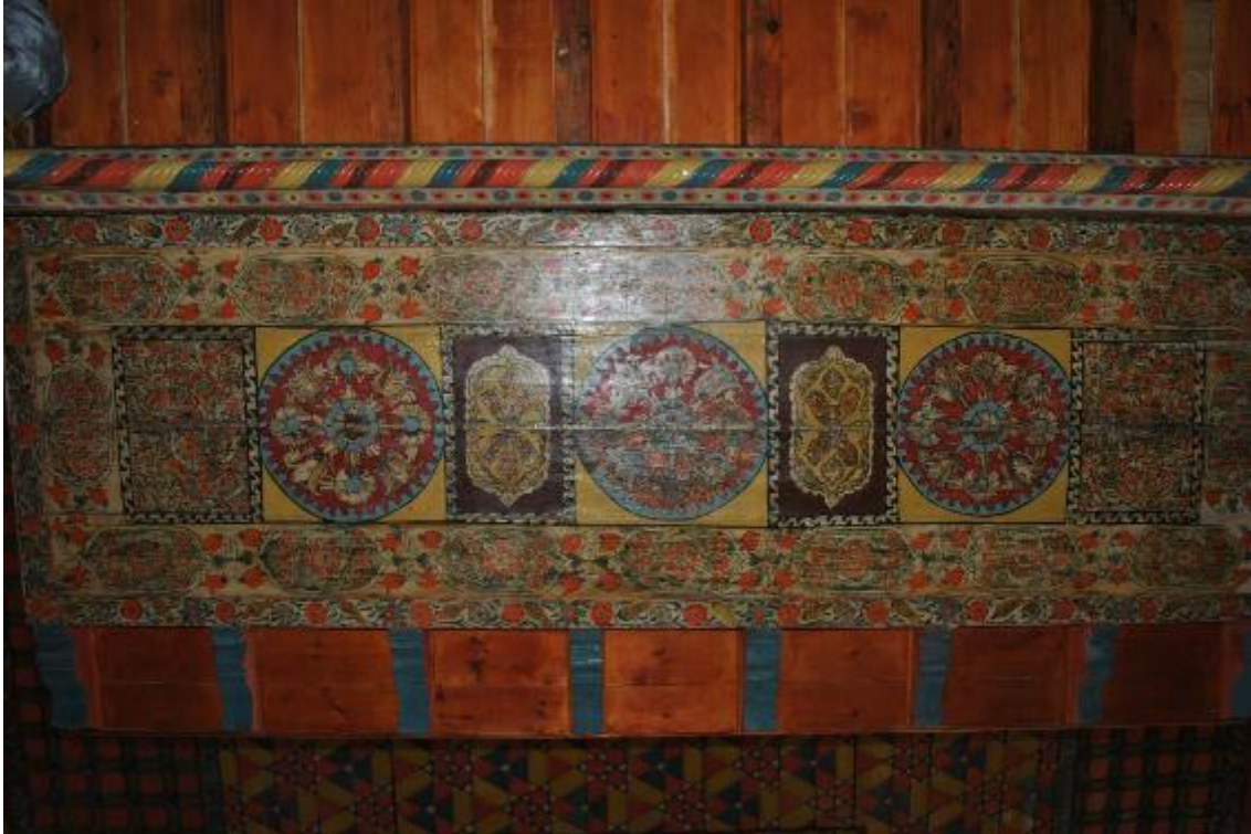
Resim 20: Kadınlar mahfili balkon tabanı zemine bakan yüzey