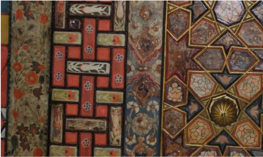
Resim 12: Tavan göbeğini çevreleyen bordürler (detay)