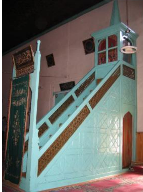
Resim 24: Minber (restorasyon öncesi)