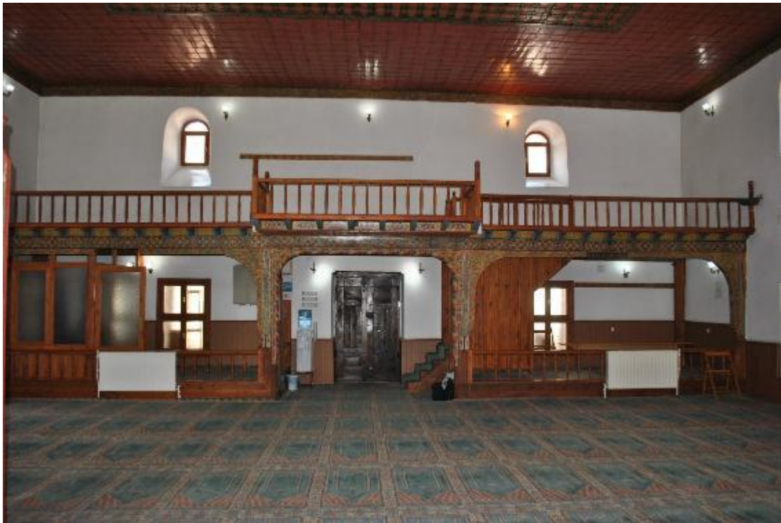
Resim 6: Harim (kuzey cephe)