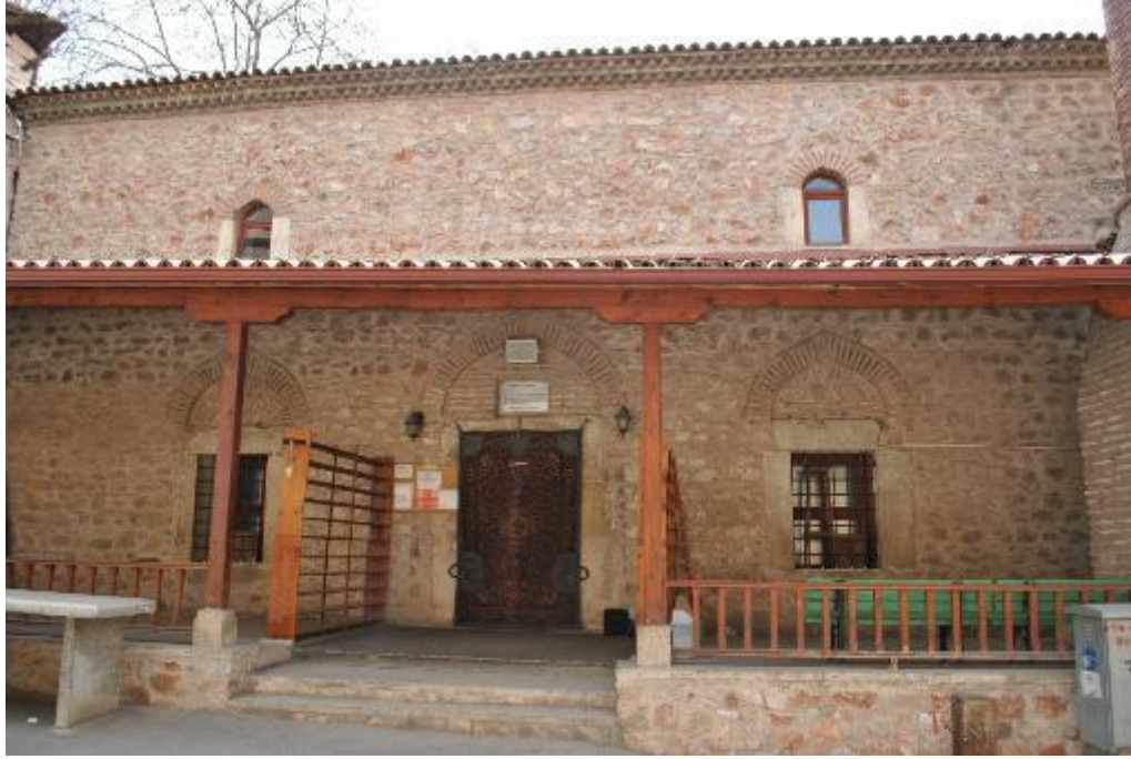
Resim 1: Mahmut Paşa Camii kuzey cephe