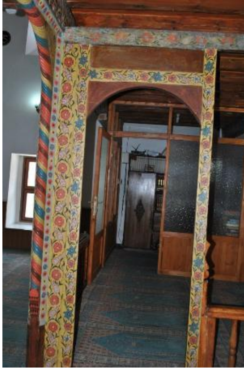
Resim 21: Kadınlar mahfili sekilere geçişi sağlayan kapı