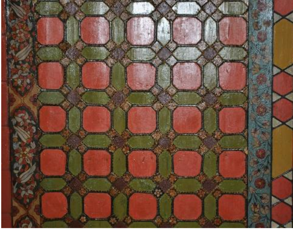
Resim 13: Tavan göbeğini çevreleyen bordürler (detay)