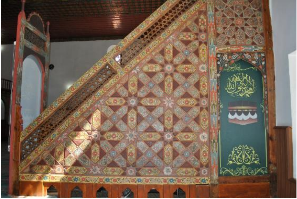
Resim 29: Minber batı cephe