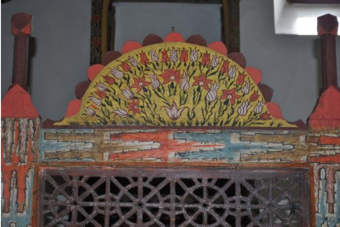
Resim 28: Minber giriř kapısı süsleme detayı