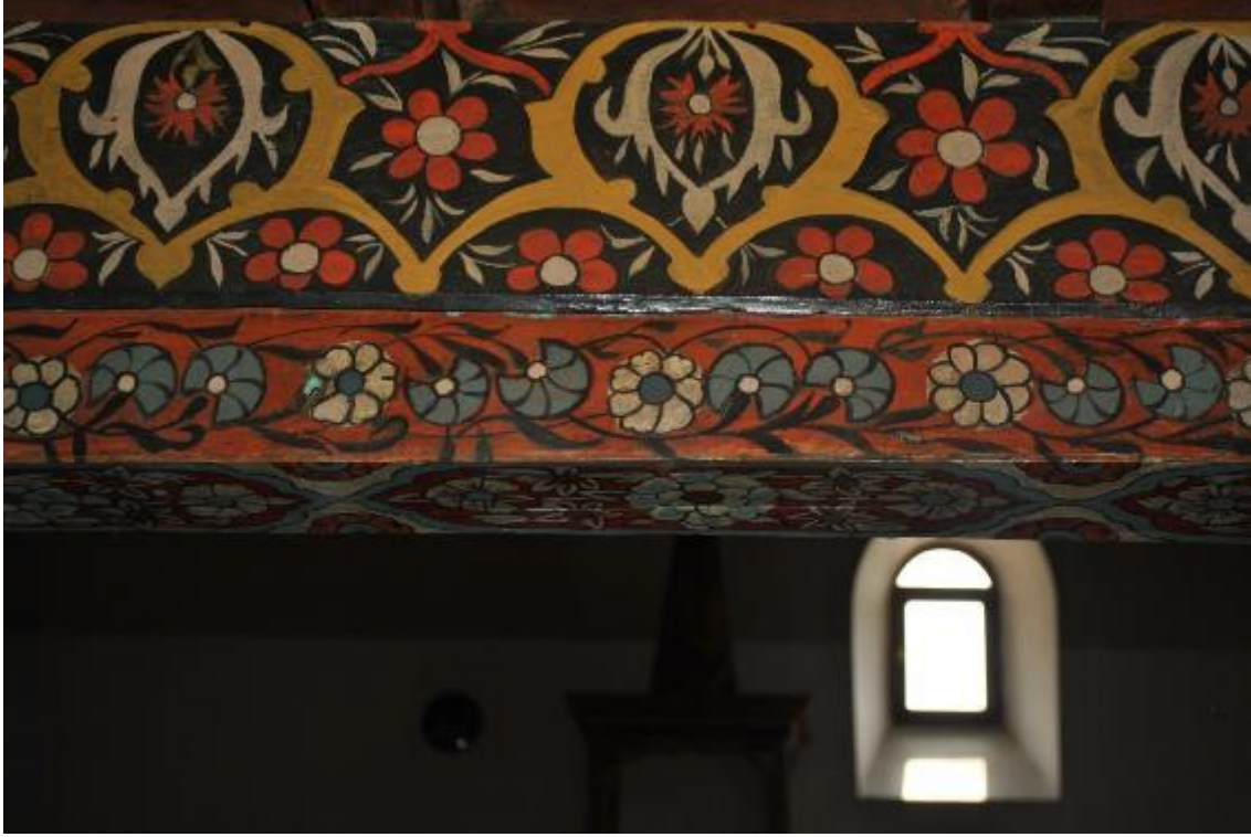
Resim 23: Kadınlar mahfili arka (kuzey) cephe bordür detayı