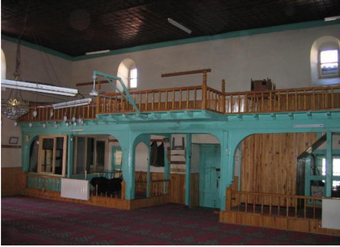
Resim 15: Kadınlar mahfili (restorasyon öncesi)