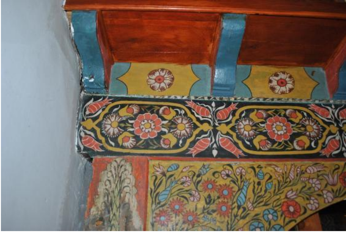
Resim 19: Kadınlar mahfili ön (güney) cephe bordür detayı