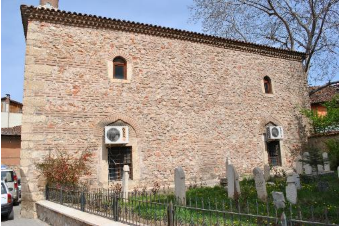
Resim 4: Mahmut Paşa Camii güney cephe ve hazire