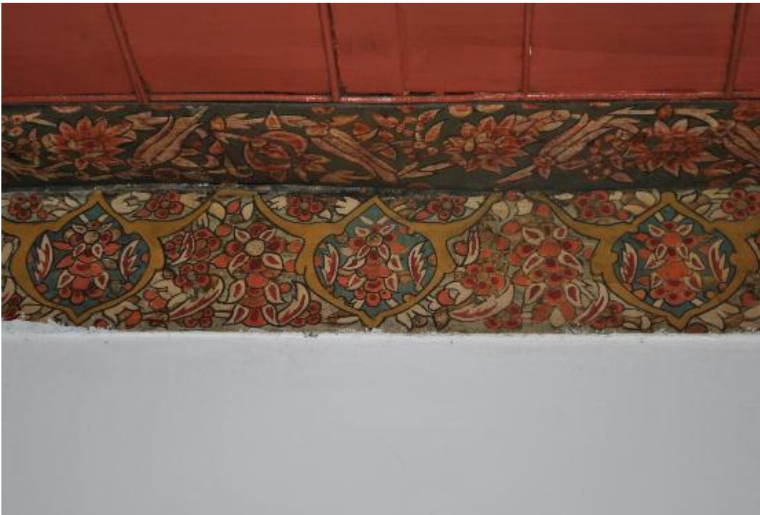
Resim 14: Tavanı sınırlandıran bordür ve pervaz