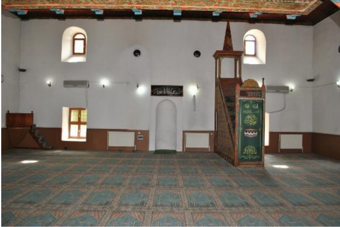
Resim 5: Harim (güney cephe)