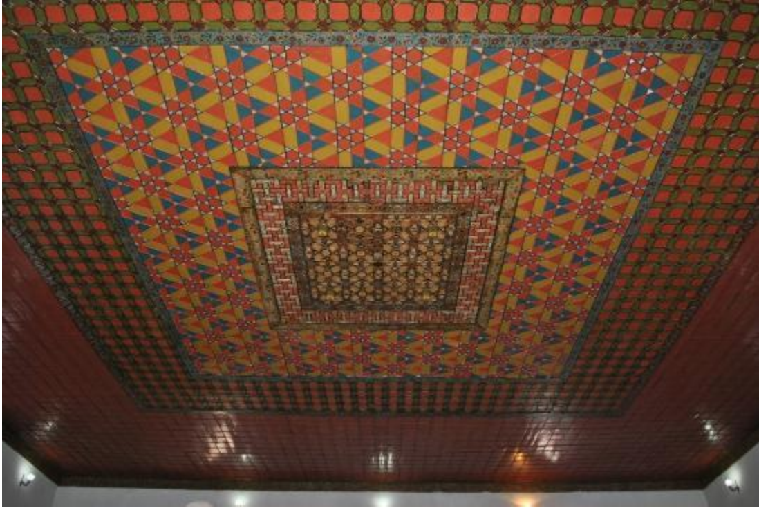
Resim 9: Tavan