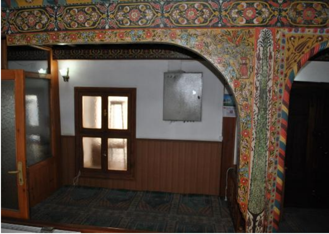
Resim 17: Kadınlar mahfili ön (güney) cephe (detay)