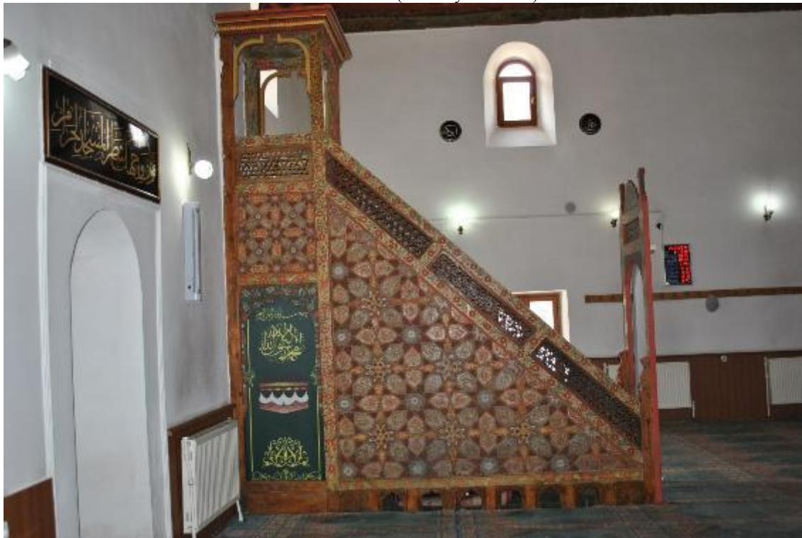
Resim 26: Minber dođu cephe