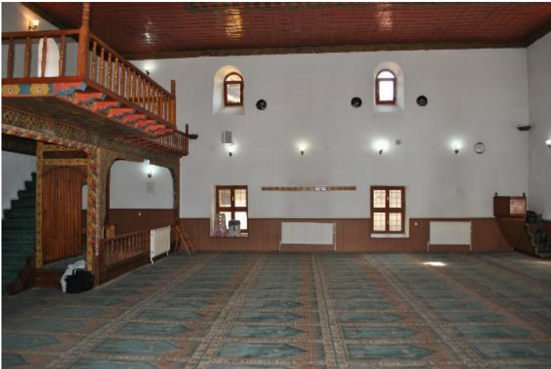
Resim 8: Harim (doğu cephe)