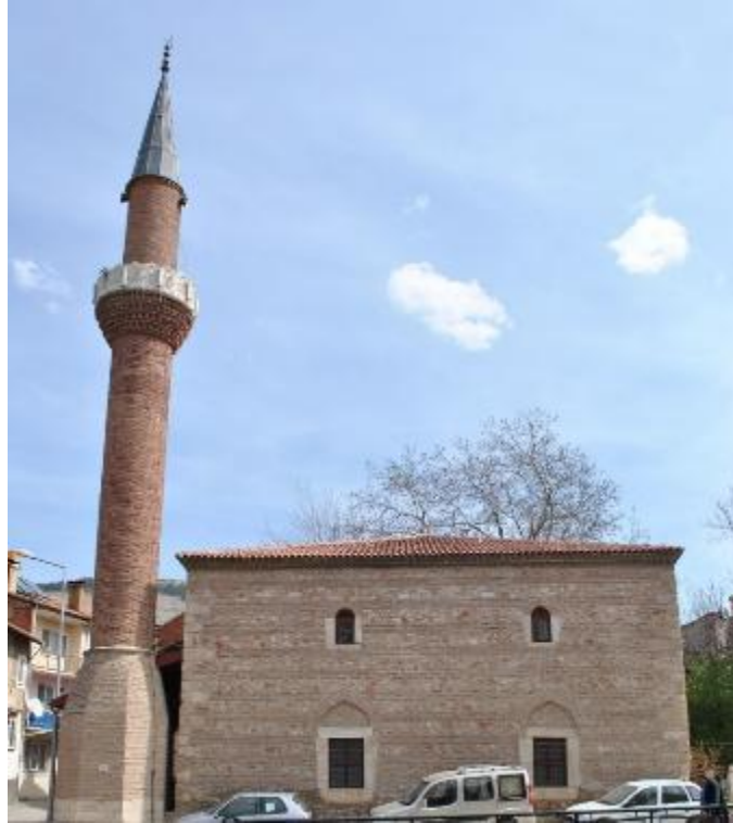
Resim 2: Mahmut Paşa Camii batı cephe