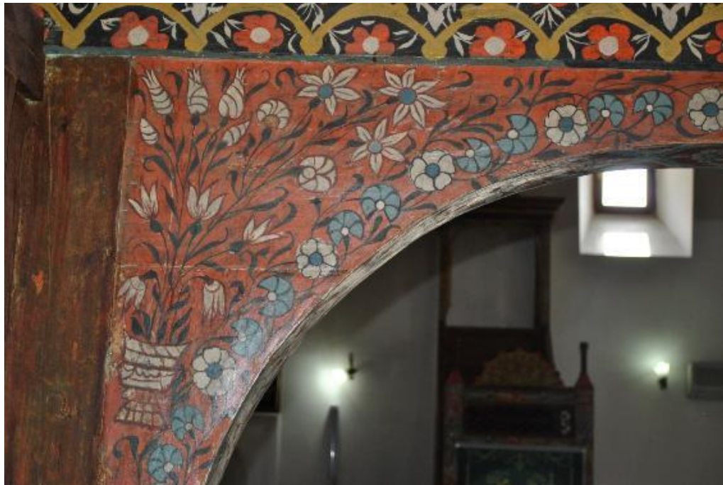
Resim 22: Kadınlar mahfili arka (kuzey) cephe kemer köşeliği vazodan çıkan çiçekler