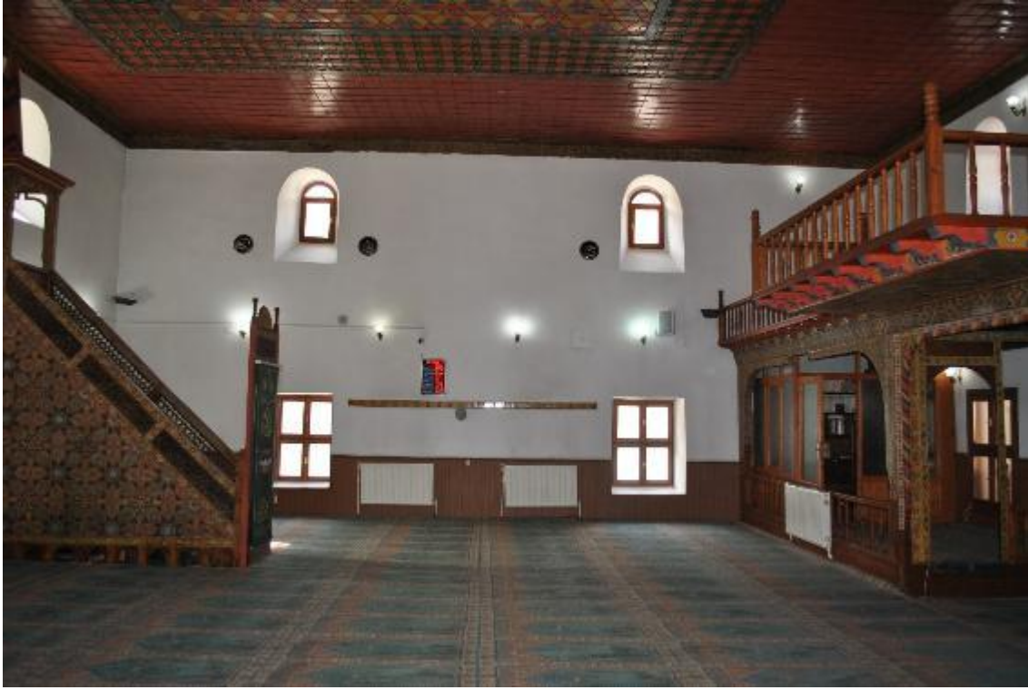
Resim 7: Harim (batı cephe)