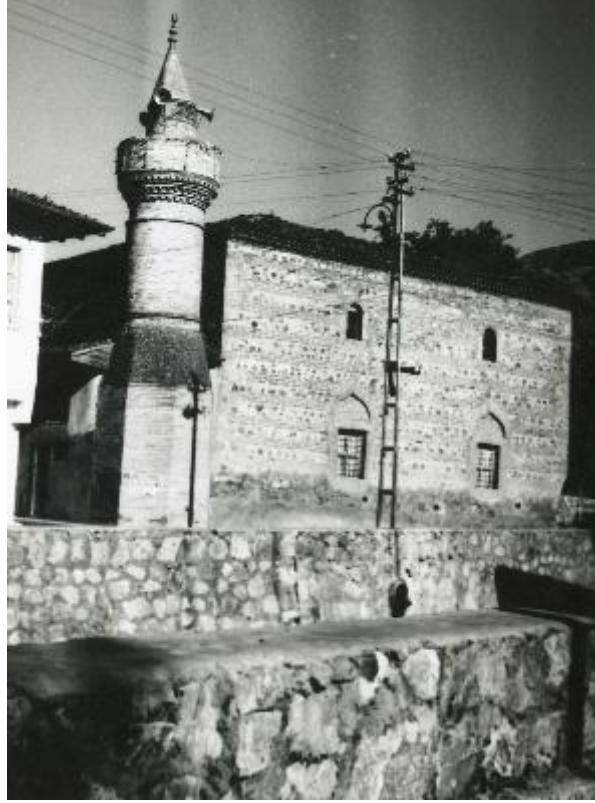
Resim 3: Mahmut Paşa Camii batı cephe (eski fotoğraf)