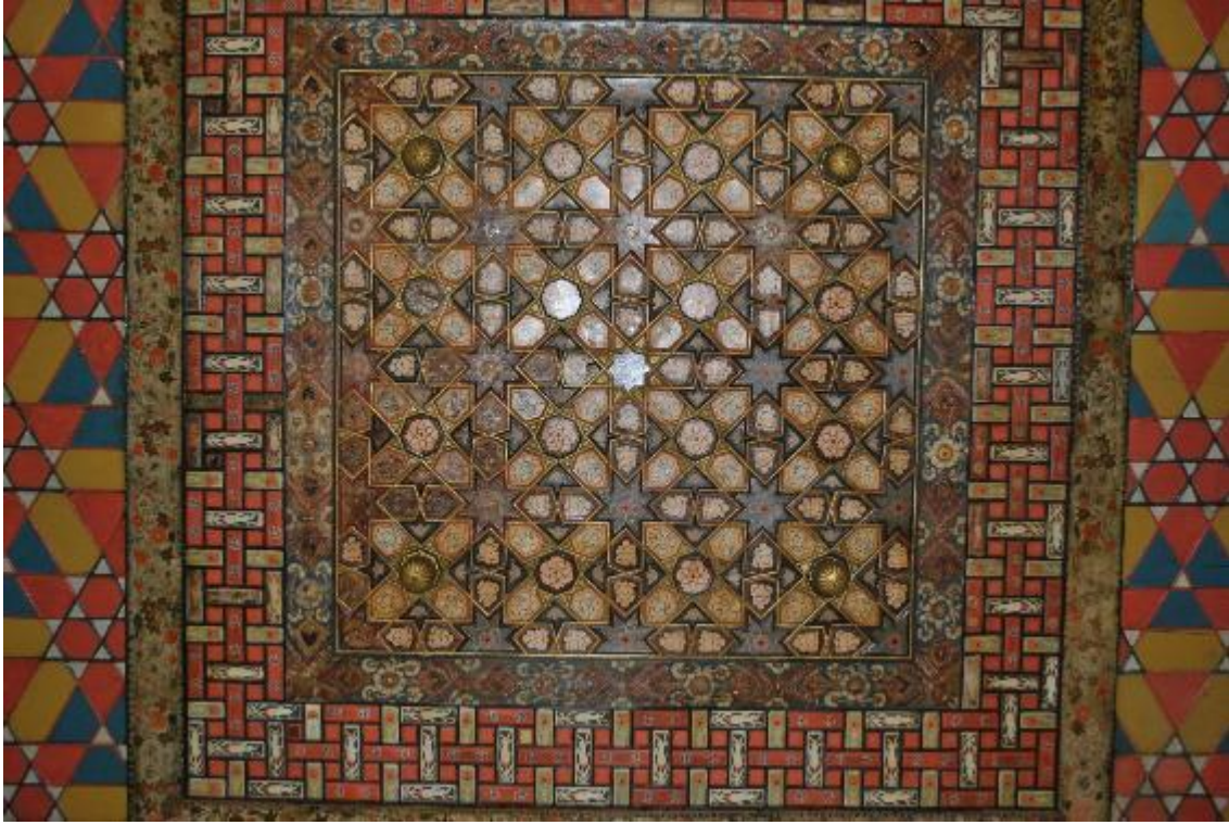
Resim 11: Tavan göbeği