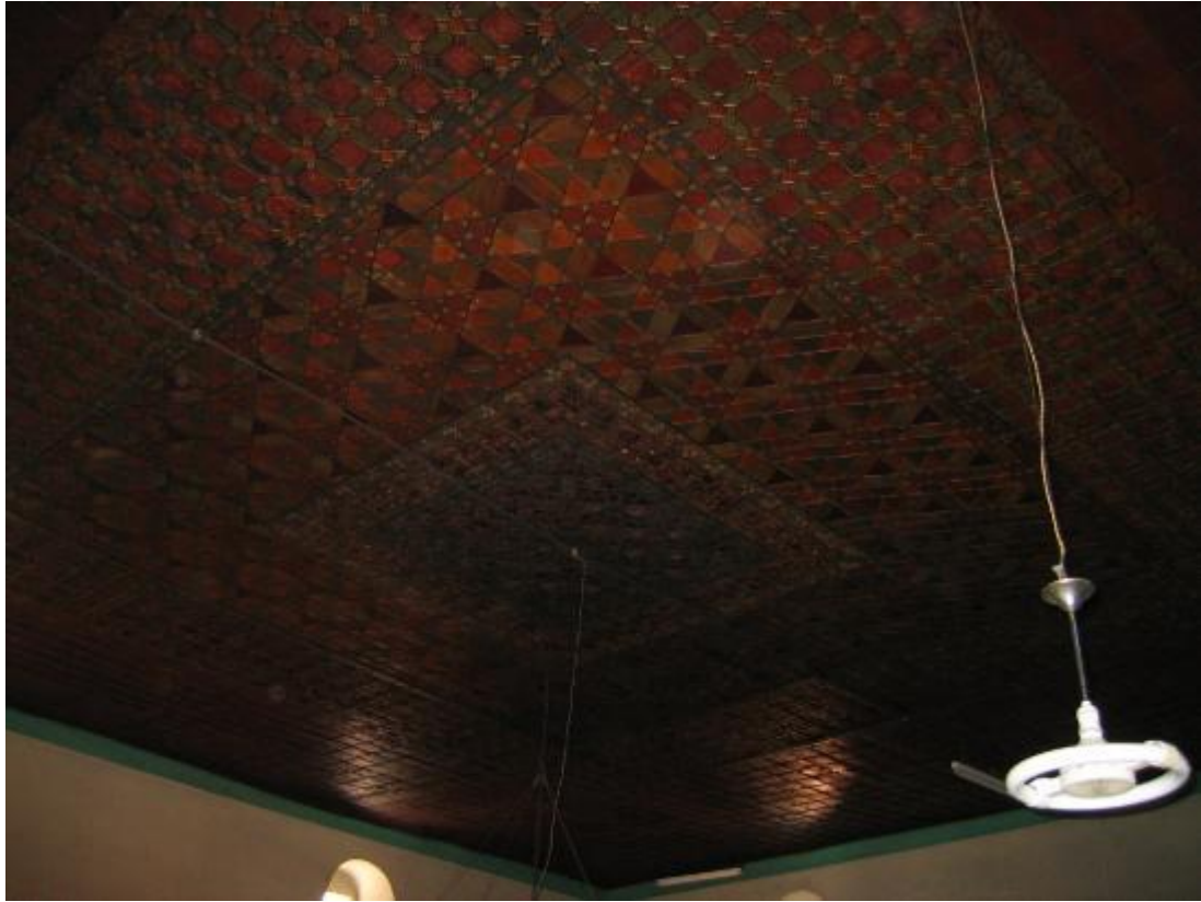
Resim 10: Tavan (restorasyon öncesi)