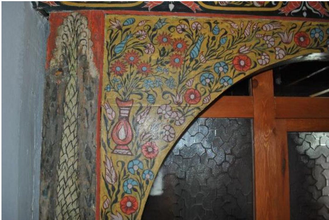
Resim 18: Kadınlar mahfili ön (güney) cephe kemer köşeliği vazodan çıkan çiçekler