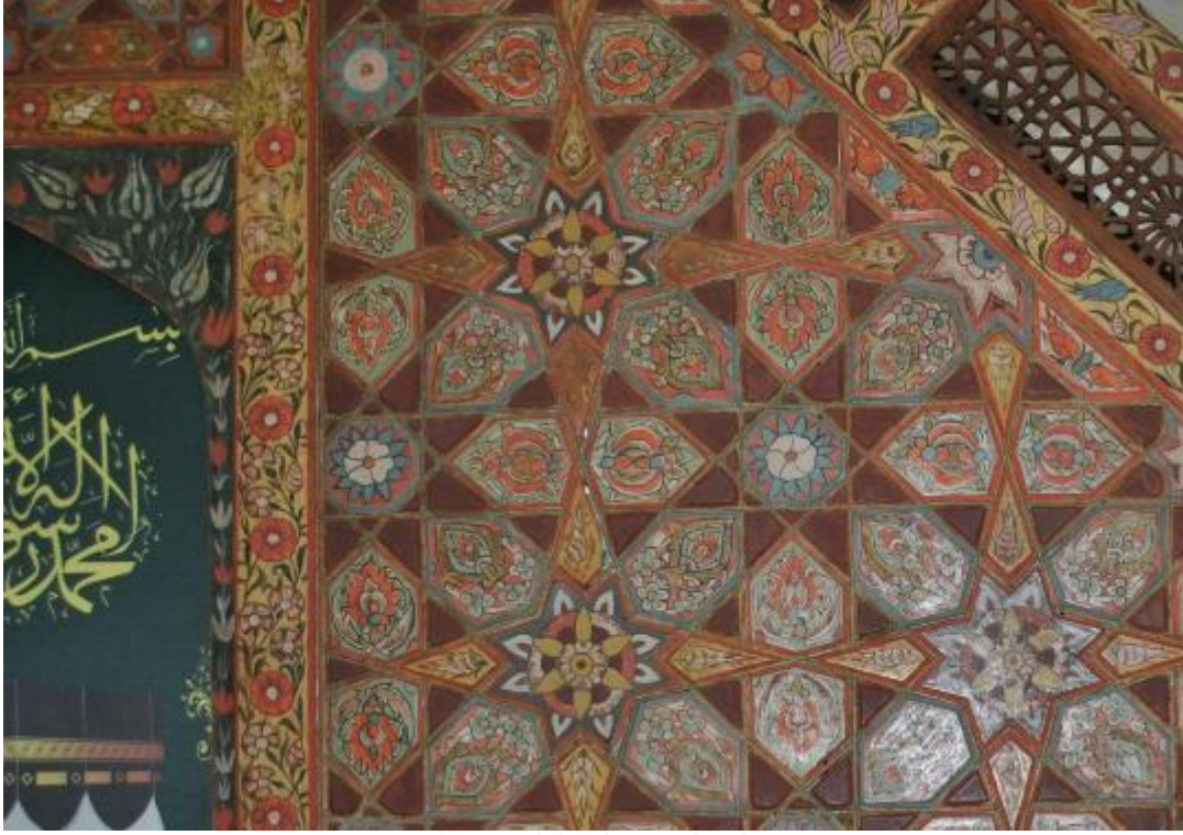
Resim 27: Minber dođu cephe (detay)