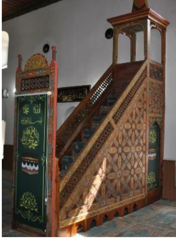
Resim 25: Minber (restorasyon sonrası)