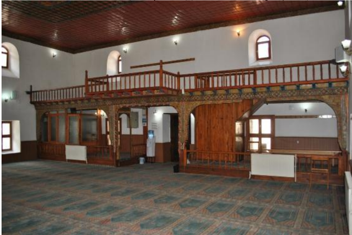
Resim 16: Kadınlar mahfili (restorasyon sonrası)