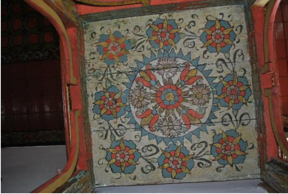
Resim 31: Minber köşku tavanı