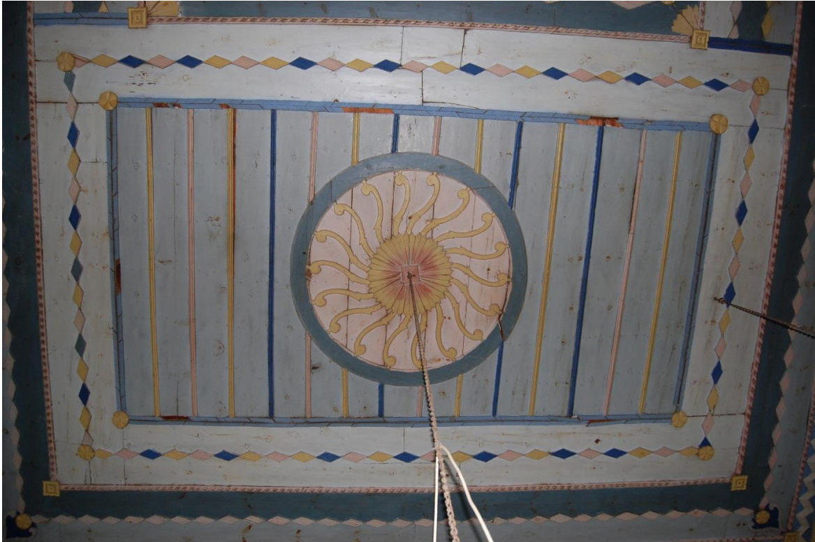
Fotoğraf -8. Bağdadi kubbenin iki tarafındaki güneş motifli tavan