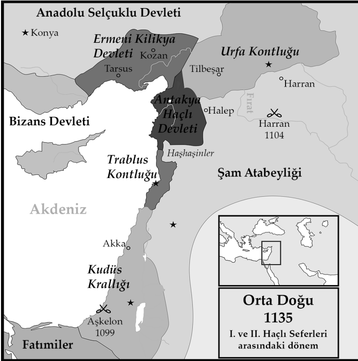
Harita 1 – Birinci Haçlı Seferinden sonra kurulan haçlı devletleri 34

Haçlı seferlerinin diğer bir sonucu ise Latin Kilisesinin, Doğu Kiliselerini daha iyi tanımasına yol açmış olmasıdır. Bu temas sonucunda Latin Kilisesi, ister patrik, ister katolikos olsun, Doğu Hıristiyan grupların liderlerini Roma'nın üstünlüğünü kabul etmeye ikna ederek kiliseleri birleştirmeye teşebbüs etmiştir. 12. yüzyılda başlatılan bu strateji, Dominiken ve Fransisken misyonerlerin faaliyetleriyle 13. yüzyılda devam etmiştir. Fakat bu yüzyılda ortaya çıkan Moğol istilası ve akabinde Haçlı devletlerinin yıkılışı, bu teşebbüsün akim kalmasıyla sonuçlanmıştır. 33