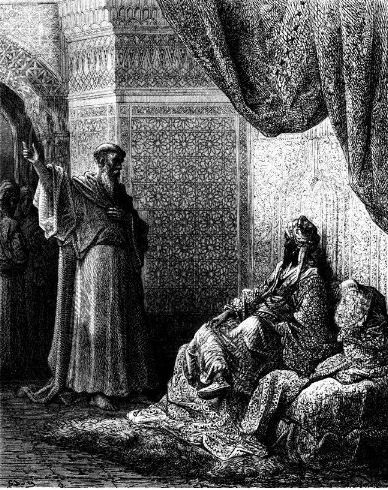
Resim 1. Gustave Doré'nin "François devant le Sultan" (Fransis Sultan'ın önünde) isimli tablosu.

Joseph-François Michaud, Histoire des croisades, illustrée de 100 grandes compositions par Gustave Doré (Paris, 1826), gravure 50, i. 402'den aktaran John Tolan, Saint Francis and the Sultan , s.2.