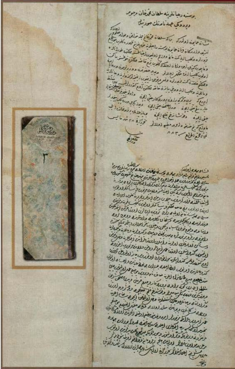
Resim 4. Fatih Bosnalı Fransisken Rahiplerine verdiği fermanın Osmanlı Arşivindeki kopyası Başbakanlık Osmanlı Arşivi, Düvel-i Ecnebiyye Defteri 14/2_1. Cevat Ekici (ed.), Gökkuşbe Altında Birlikte Yaşamak, Belgelerin Diliyle Osmanlı Hoşgörüsü Ankara: Başbakanlık Devlet Arşivleri Genel Müdürlüğü, Osmanlı Arşivleri Daire Başkanlığı Yayın Nu:77, 2006, s.2'den alınmıştır.