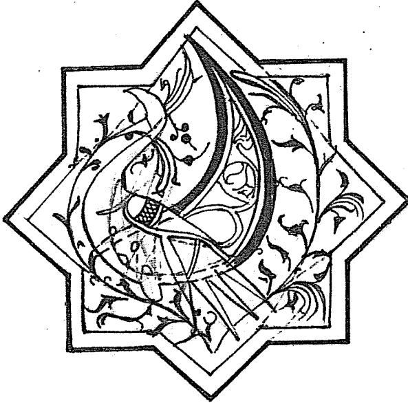
Bu çizgisel yorum Mehmet Büyükçanga tarafından hazırlanmıştır