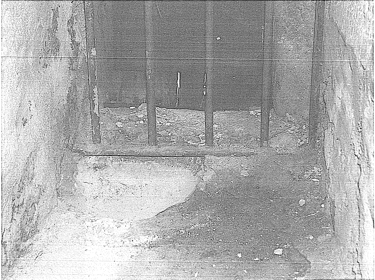
Resim 5- Çankırı Çivitçiođlu Medresesi'ndeki Sadaka Taşı'nın Yakından Görünüşü