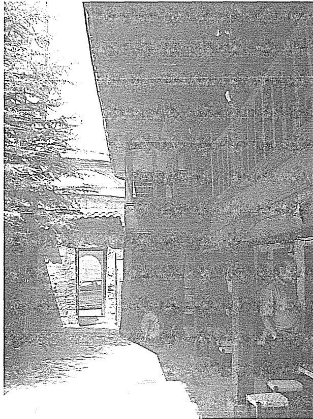
Resim 3- Çankırı Çivitçioğlu Medresesi'ndeki Sadaka Taşı'nın Avlu Tarafından Görünüşü