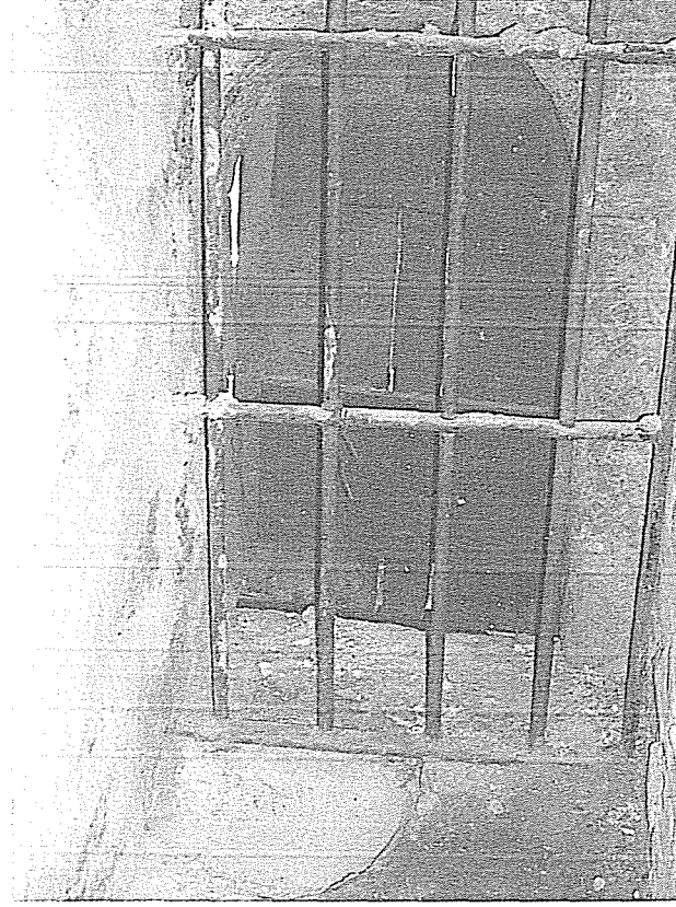
Resim 4- Çankırı Çivitçiođlu Medresesi'ndeki Sadaka Taşı'nın İçten Görünüşü