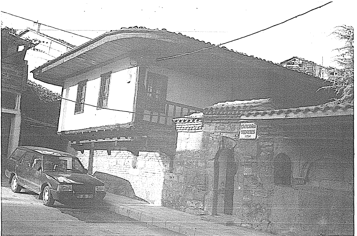
Resim 1- Çankırı Çivitçioğlu Medresesi'nde Giriş Kapısının Sağ Tarafındaki Sadaka Taşı