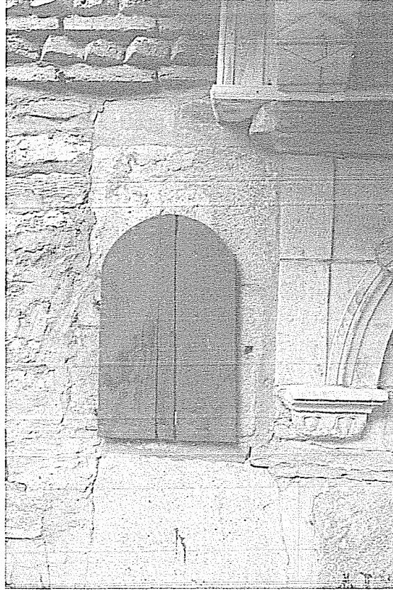
Resim 2- Çankırı Çivitçioğlu Medresesi'ndeki Sadaka Taşı'nın Dıştan Görünüşü