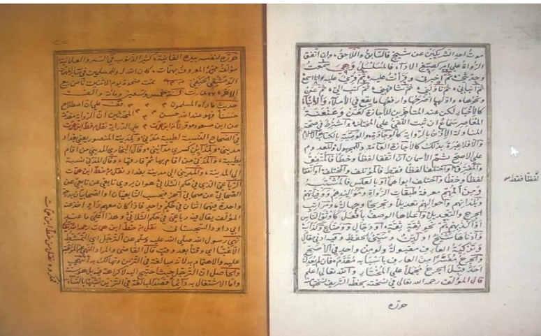
1-2. Hulâsatü'n-Nuhbe fi'l-mustalah'ın Süleymaneyi Kütüphanesi, Servili 00052'de kayıtlı Müellif Hattı Nüshanın Unvan Sayfası (23b-24b)