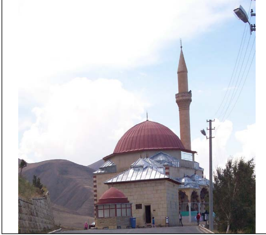
Ek I: Abdurrahman Gazi Cami ve Türbesi