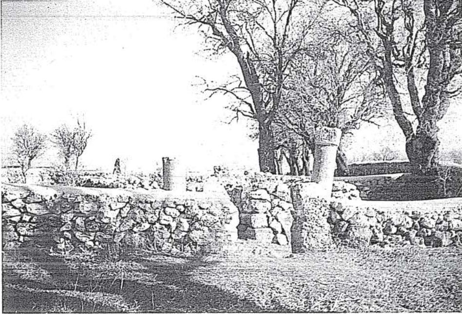
Resim-6 Burhan Abdal'a Ait Olduđu Söylenen Mezar