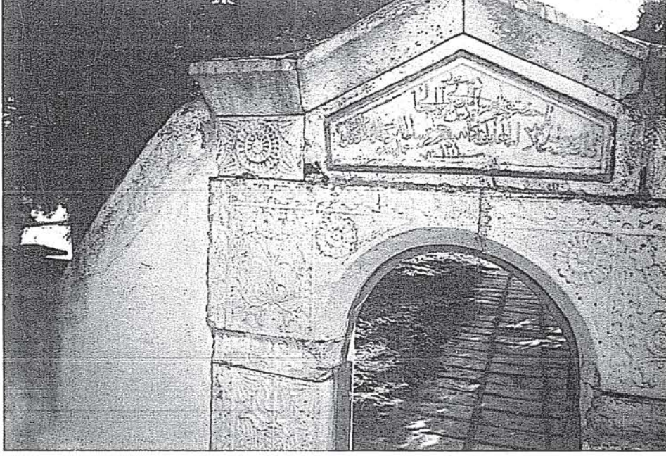
Resim-3 Türbenin Giriş Kapısı Kitabesi