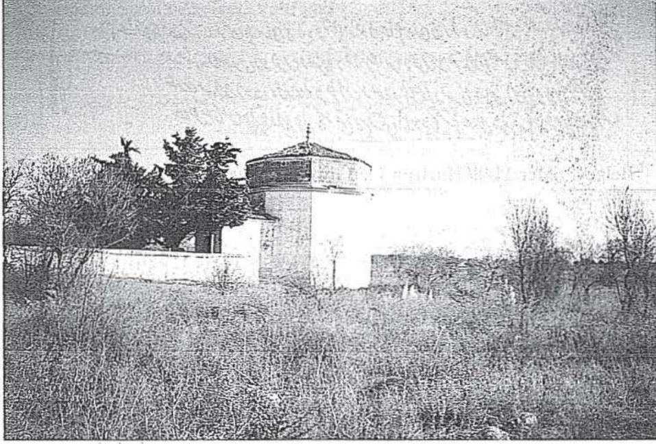
Resim-1 Hacım Sultan Türbesi