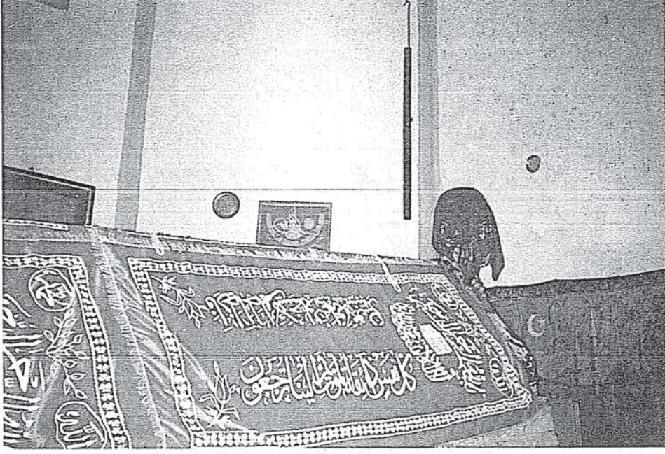
Resim-5 Hacım Sultan Sandukası ve Asası