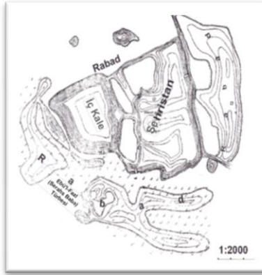
Şekil 2: Serahs'ın Şehir Merkezi Haritası

Hudûdu'l-Âlem müellifi şehir merkezine su taşıyan Haşekrûd adında bir nehir kolundan bahsetmektedir. Sadece suların yükseldiği zamanlarda akan bu nehir kolu çarşının ortasından geçmekteydi. 43 Serahs'ın Herat nehrinden ayrılan tüm kolları, tıpkı şehir merkezine uğrayan kolu gibi senenin sadece belirli günlerinde akmaktaydı. Bu sebeple halk, nehir kolları üzerinde yer alan değirmenlerini hayvan gücüyle çalıştırmaktaydılar. İçme sularını ise çoğunlukla açtıkları su kuyula-