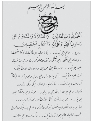
Hattat Halim Özyazıcı tarafından istinsah edilen Abdülhakim Arvâsî'nin "Rûh" isimli eserinin birinci sayfası.

Abdülhakim Arvâsî'ye göre tasavvuf; ilmî, zevkî ve vicdânî bir husûs olduğundan dolayı şânına lâyık bir şekilde insanların anlayacağı bir dille ifadesi mümkün değildir. 65 Konuyla ilgili olarak Abdülhakim Arvâsî, şu örneğe yer vermektedir: Nasıl ki yemeğin lezzeti çatal ve bıçakla aranıp bulunamıyorsa, ona göre tasavvuf da akılla tam olarak kavranamaz. 66 Bu mânâda "sûfî" kelimesinin menşeiini gönlün bütün yabancı unsurlardan arındırılarak ilâhî zikirle donatılması ve böylece kalbin safâsını kazanması olarak açıklamaktadır. 67 Kısaca ona göre tasavvuf, sûfnin beşerî sıfatlardan çıkıp melekî sıfatlara bürünmesi ve böylece en yüce ilâhî ahlâka sahip olmasıdır. 68