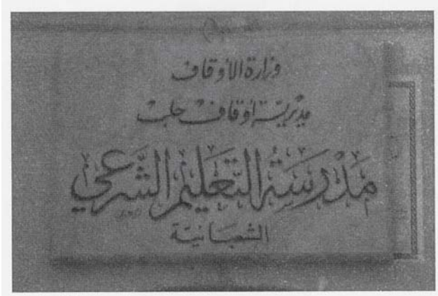
Resim 2: Medresenin Kitabesi