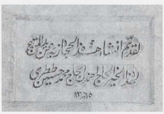
Resim 5: Hicaziyenin Kitabesi