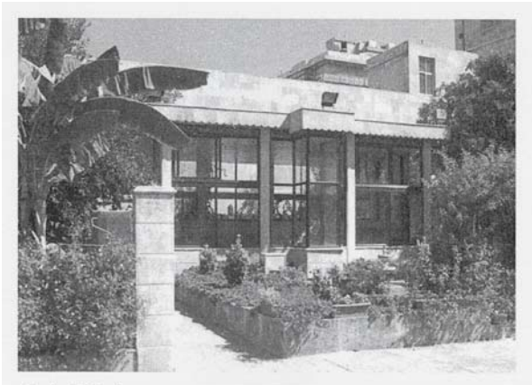
Resim 3: Şadırvan