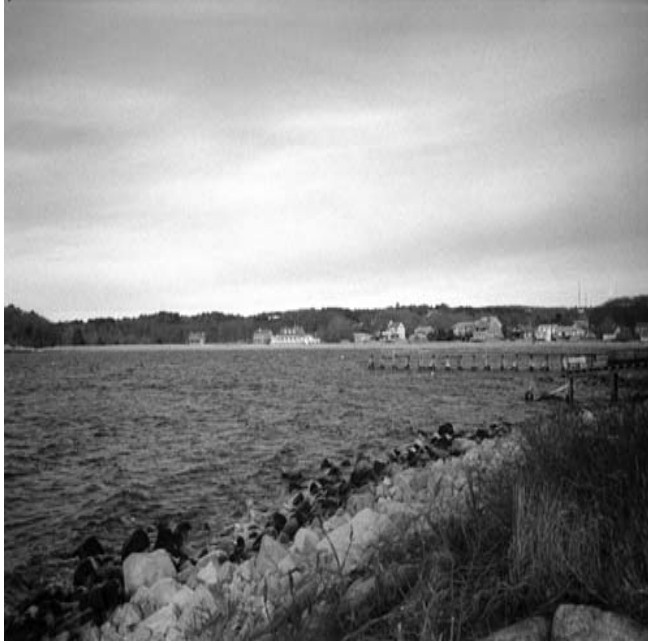
Resim 7: “Her gün 100. Mezmur'u ezberden okuduğum yer işte tam da bu nokta civarındır” (Theresa Collins)

“Evet, burayı (Resim 7) gezmeye çıktığımda, bir çeşit rahatlama işte. Bu nokta civarında günlük ezberden 100. Mezmur'u okurum ki, gerçekten 100. Mezmurdaki “Ey bütün dünya! Rabbe sevinç çığlıkları yükseltin” diye başlayan bölüme kadar okumayı seviyorum. Şahane kutlu bir Mezmur. Sabahleyin Tanrıyla benim resmi sohbetimin bir tür şahlanışı ve buradaki şu köşeye geldiğim zaman genelde olan şey budur. Yaşadığım bu muhteşem yer için Tanrı'ya ne kadar teşekkür etsem azdır.”