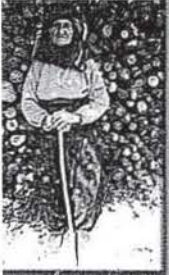
çizimler: Ayhan Aydın