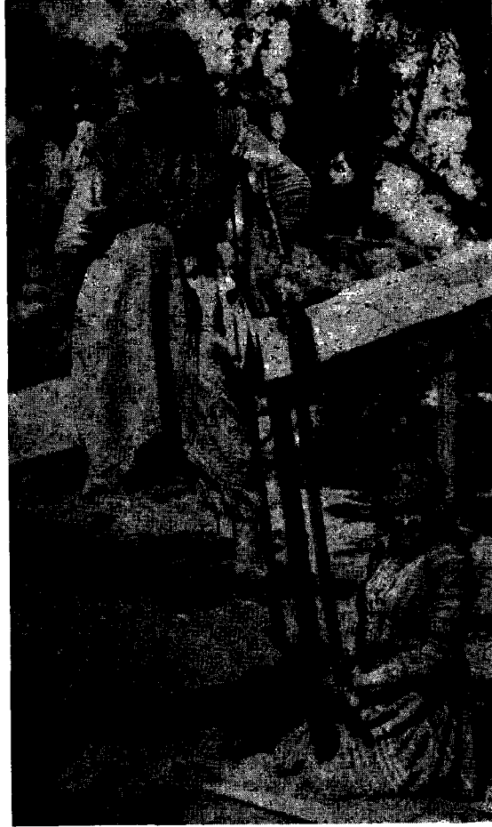
Antalya tahtacılarından iki kadın

halde — Kızılbaşlıkları hesabıle camia arasında hor görüldüklerinden olacak ki — tab'an mülayim ve hödük olmuşlardır. Orman ve kereste sahipleri olan müte-gallibe ağa ve tüccarın boyunduruğunda yaşamak, geçinmek mecburiyetinin de bu tabiat üzerinde amil olduğu şüphesizdir.