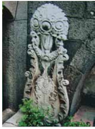
Fotoğraf 2-Soyut heykel biçimli kadın mezar taşı Habib Baba Türbesi 19. yy. Erzurum