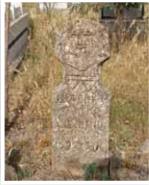
Fotoğraf 19-Heykel biçimli mezar Taşı İnce Araplar Köyü/Besni-Adıyaman

Orta Asya'dan gelen yeni göçlerin etkisi ile Anadolu'nun çeşitli bölgelerinde somut insan biçimli veya figürlü mezar taşlarının yapılması, geleneğin devam ettirilmesi bakımından büyük önem arz eder.