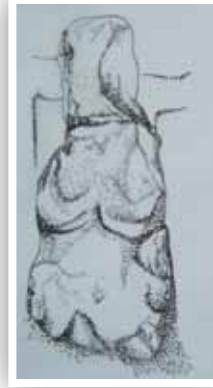
Çizim 5- Oturur biçimde yontulmuş insan heykel biçimli mezar taşının çizimi

Bir diğ er örneğ imiz de 142x75x25 cm ölçülerinde olup (Fotoğraf -7/ Çizim-5), baş gövde kısmı sağlam, oturur biçimde ve özentisiz ve üç boyutlu olarak yontulmuştur. Heykelin elleri önde göğüs hizasında birleştirilmiş ve gövdenin alt kısmına göre hafif yüksek kabartma tekniğinde işlendiği görülmektedir. Boyun kısmı da yine kazıma tekniğinde yontularak özellikle belirtilmiştir. Eserin üzerinde yazı, desen ve figür olarak herhangi bir süsleme bulunmamakta, ayrıca getirildiği yer de bilinmemektedir. Üslup olarak Azerbaycan-Kelbecer, Lâçin, Şemahlı ve Ağdam bölgesi heykelleri ile benzerlik gösteren bu heykel biçimli mezar taşının, VIII. yüzyıl sonrasına ait olabileceğini düşünmekteyiz.