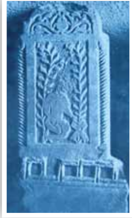
Fotoğraf 22-Figürlü mezar taşı Akşehir