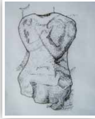
Çizim 6- Oturur biçimde yontulmuş insan heykel biçimli mezar taşının çizimi

Son örneğimiz de 133x58x24 cm ölçülerinde olup (Fotoğraf-8/Çizim-6), Azerbaycan-Şemahlı bölgesi Dağkölan köyünden getirilmiştir (Efendi, 1986: 22). Oturur biçimde, elleri önde göğüs hizasında çapraz vaziyette birleştirilmiş tarzda işlenen heykelin başı kopmuştur. Eserin oturuş biçimi, Göktürk dönemi heykelleri ile benzerlik göstermesi, aynı sanat kaynağından beslenen bir üslup birliğini yansıtmaya bakımdan önemlidir. Heykeldeki temiz işçilik ve gösterilen özen, bunun IX. veya X. yüzyıla ait olabileceğini göstermektedir. Gerçekten de bu dönem ve sonralarında Azerbaycan bölgesi mezar taşları ve heykellerinde oldukça temiz işçilik göze çarpmaktadır.