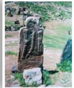
Fotoğraf 25- Çeşitli silah motiflerinin işlendiği mezar taşı Hınıs-Erzurum