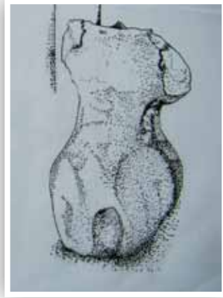
Çizim 1- Bayan mezar taşının çizimi (Bakü-Azerbaycan)

Bu örneklerde yöresel sanatçılar, bize göre sanki yonttukları heykelin sanat eseri özelliğinden ziyade, verdiği mesajı öne çıkarma kaygısı içindedirler. Belki de bu yüzden, yontuyu işçilik açısından fazla önemsemedikleri düşünülebilir.