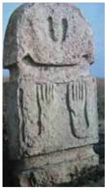
Fotoğraf 5- Heykel biçimli mezar taşı Boy Ahmetli Köyü/Karabağ (R.Efendi)