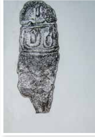
Çizim 4- Heykel biçimli mezar taşının çizimi (Bakü-Azerbaycan)