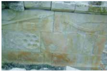
Fotoğraf 24- Kün-ay, silah ve tarak motifinin işlendiği sanduka tipi mezarlık Çayırılı/Erzincan