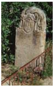
Fotoğraf 13- Zhunkara anıt mezar taşı Göktürk Dönemi (N. Diyarbekirli)

Taş heykellerin de mezar heykeli veya bizzat mezarda yatan ölüyü temsil ettiğini (Çoruhlu, 1998: 99), hatta heykelin tam altında ölüye ait küllerin bulunduğunu ileri süren araştırmacılar olduğu gibi (Ivanovovsky, 1892: 10), bazı araştırmacıların da bu heykellerin, bazen saygı gösterilen ruhları da temsil eden yontular (ongun) olduğu iddiaları dikkate alınmalıdır (Çoruhlu, 1998: 99-100). Bu tür taş heykeller üç boyutlu heykel formunda olabildiği gibi, çoğu zaman taşa kazınmış, alçak veya yüksek kabartma tarzında da olabiliyordu. Ölünün anısına, mezarına taş heykellerin dikilmesi geleneğinin, günümüz dünyasında hâlâ kullanılması, ilgi çekicidir (Fotoğraf-13-14).