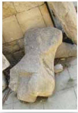
Fotoğraf 8- Oturur biçimde yontulmuş insan heykel biçimli mezar taşı (Bakü- Azerbaycan)