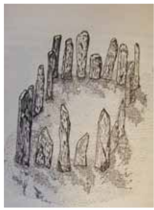
Çizim 2- Güney Sibirya'da kurgan etrafındaki taş balballar (Radlov)