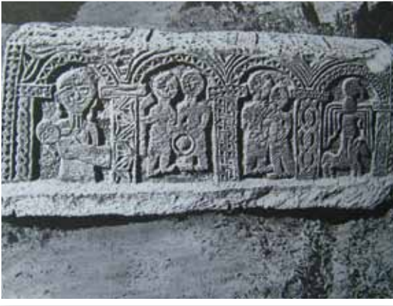
Fotoğraf 21- Sanduka biçimli figürlü mezar taşı Urud Köyü-Sisian-Azerbaycan (R. Efendi)