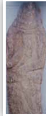
Fotoğraf 6- İskit dönemi taş heykel M.Ö VII ila V. yy. Kiev (O. Belli)

Biçim olarak insan formunda, 175x53x21 cm boyutlarında olan bir diğer heykel ise baş kısmı yuvarlak, gövde ise dikdörtgen şeklinde işlenmiştir (Fotoğraf-4 / Çizim-4). Bu tarz heykellerin bazılarının baş kısmının yuvarlak, bazılarının ise düz verilmesinin, toplumsal bir statü ile alakalı olabileceği araştırmacılar tarafından ileri sürülmekte (Gumilev, 1993: 261), en erken örneklerine ise Neolitik dönemde, Anadolu'da Göbekli Tepe'de rastlanmaktadır (Schmidt, 2007: 83-84). Alt kısmının sivri bir şekilde yontulması kanaatimizce heykeli toprağa daha rahat gömmek için olmalıdır. Kırgızistan'da bulunan benzer örneklerin de aynı biçimde yontulması