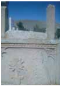
Fotoğraf 23- İnsan figürlü sanduka biçimli mezar Çayırılı/Erzincan

Erken Osmanlı medeniyetinde de bu geleneğin devam ettirildiği ancak dönem ilerledikçe somut formlardan soyutlaşmaya doğru bir eğilimin olduğu göze