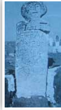
Fotoğraf 20-Heykel biçimli mezar taşı Aşağı Çağlayan/Eskişehir (B.Karamağaralı)

1243 Köseadağ Savaşı öncesi ve sonrası, Moğol istilacılarının önünden Orta Asya'dan kaçan çeşitli Türkmen topluluklarının Anadolu'ya gelmeleri ile Azerbaycan ve Anadolu'daki mimari yapılarda ve el sanatlarında figüratif bezemelerin arttığı dikkati çeker. Özellikle bu dönemde batıya ihraç edilen ve Avrupa'da kraliyet aileleri ile kilisenin törenlerde kullandıkları kaftanlardaki yazı ve figürler ile (Rosamond , 2005: 96-106-108) sergi amaçlı halılarda (Yetkin, 1991: 24-25), figüratif bezemeli bu etkiler daha nettir. Bazı bölgelerde örneklerin oldukça basit tarzda yontuldukları, orantıya dikkat edilmediği görülür (Fotoğraf 20). Bazı bölgelerde ise ince bir işçilikle dikkatli bir gözlemin eser üzerinde birleştirildiği görülür. Heykellerde özellikle simetrisinin olmaması; yontan sanatkarın sanat kaygısından ziyade mezar anıtında bir geleneği yerine getirme çabasıyla ürünü ortaya koyduğu düşüncesini akla getirmektedir. Örneklerimizin bir kısmında, ölen insanın cinsiyeti, yazı ile belirtildiği gibi çoğu zaman çeşitli ziynet eşyaları, mesleki işaretler veya kullandığı günlük eşyalarla öne çıkarılır.