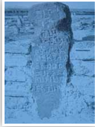
Fotoğraf 3-Eskişehir yöresinden heykel biçimli mezar taşı (B. Karamağaralı)