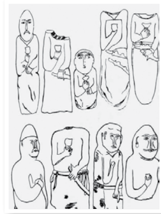
Çizim 3- Göktürk dönemi heykel biçimli mezar taşları (Radlov)

Yöresel sanatçı bu yönü ile yontulan heykel, mezarda yatan kişiyi sosyoekonomik ve dinî özellikleri ile değil de sadece biçim olarak anlatmayı yeterli görmüş gibidir. Bu tür taş heykellerin, üzerinde her ne kadar süsleme elemanlarına yer verilmemişse de vücut hatlarının biçimli oluşu bunu balballardan ayırmaktadır. Çünkü balbalları taş heykellerden ayıran en önemli özellik, kaba ve orantsız olmalarıdır (Belli, 2003: 37). Bazen büyük yontulmamış tek parça bir taşın bile balbal olarak kullanıldığı görülmektedir (Fotoğraf-11).