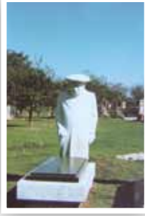
Fotoğraf 15-Musevi/Türk mezar taşı Kuba/Azerbaycan