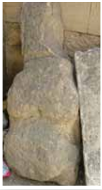
Fotoğraf 7- Oturur biçimde yontulmuş insan heykel biçimli mezar taşı (Bakü-Azerbaycan)

iddiamızı doğrulamaktadır. Heykelin baş ve gövde bölümünü belirleyen geniş konturlu derin silmeler, dikey görüntüyü dengeleyen yatay çizgiler olarak dikkat çekmektedir. Baş kısmında kazıma tekniğinde göz ve burun üsluplaştırılarak verilmiş, ağız kısmı ise gövde ile baş kısmını çevreleyen derin kontur çizgisi ile verilmeye çalışılmıştır. Böylece heykelde bir soyutlaşma çabasının olduğu dikkati çekmektedir. Heykelin gövde kısmında ise asimetrik şekilde yerleştirilmiş karşılıklı birer el kabartması dirsekten yukarı kıvrık biçimde, parmaklar açık göğse yapışık bir şekilde işlenmiştir. Oldukça etkileyici bir formda verilen bu heykelin benzer örnekleri yine Azerbaycan'ın Karabağ-Ağdam bölgesi, Boy Ahmetli Köyü'nde bulunmaktadır (Fotoğraf -5). Yine bugün Kiev müzesinde sergilenen ve M.Ö. VII-V. yüzyıla tarihlendirilen bir İskit taş heykeli (Belli, 2003: 42) ile büyük bir benzerlik gösteren bu heykel, bize göre İskit geleneğinin geç dönem örneği olmalıdır (Fotoğraf -6).