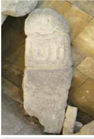
Fotoğraf 4- Erkek için yontulmuş insan heykel biçimli mezar taşı (Bakü-Azerbaycan)