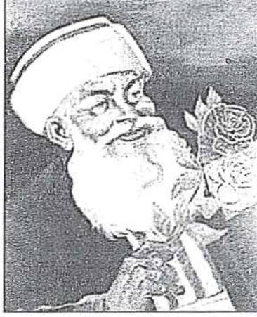
Galatasaray Lisesi Müzesi'nde bulunan temsili Gül Baba portresi

Okulu'nu yaptırdı ve Gül Baba da ilk hocalardan biri oldu. Gül Baba'nın Bektaşî Babası olması, Bektaşî kültür ve felsefesinin Galatasaray'da daima etkin olmasına yol açmıştır.