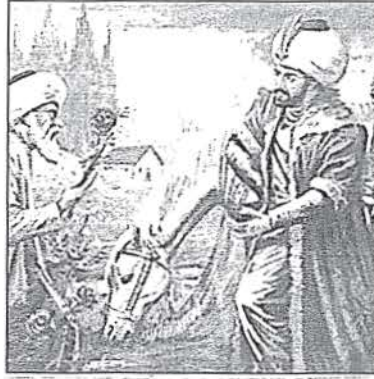
Gül Baba ve Sultan II. Bayezid 7

Tahta çıkışının ilk yılı 1481 yılının soğuk bir kış günü maiyeti ile birlikte Tophane sırtlarında avlanmaya çıkan 30 yaşındaki II. Bayezid, av sırasında şiddetli rüzgâr ve soğuktan rahatsız olarak dinlenmek ve ısınmak için bir barınak ararken, Tophane'den Beyoğlu'na çıkan ve bu günkü Galatasaray'ın yakınındaki Boğazkesen noktasında bulunan bir kulübe gözüne ilişir. Gül fidanları ile dolu bir bahçede saygın yüzlü ve Allah'a yakaran bir ihtiyar görerek bahçeye girer. Padişah, günah-tan sakınan, geçici dünya nimetlerine değer vermeyen bir yaratılıştaki olan ve küçücük kulübesinde gülleriyle bas basa yasayan ve bu yüzden kendisine Gül Baba adı verilen bu kişinin sohbetinden, yakınlıktan zevk duyarak; Bir dilhahınız (isteğiniz) var mıdır? diye sorar. Gül Baba, parmağıyla bugünkü Galatasaray Lisesi'nin bulunduğu tepelik araziye işaret ederek şu dilekte bulunur: "Padişahım, şu zirveciğe bir mekteb-i irfan tesis et ve orada okuyup yazanları hizmet-i hümayununda istihdam eyle. Vakten min - el evkat (her zaman) devletine lazım olur." II. Bayezid, Gül Baba'nın eliyle gösterdiği 30 bin zirayı asan arazinin çevresine duvar çektirerek, bir cami, 200 kişiyi barındırabilecek bir koğuş, bir hamam, zabıt dairesi ve mutfak yaptırır. Yönetimine de bir Ak Ağa'yı Galaşa Sarayı Ağası olarak atar.