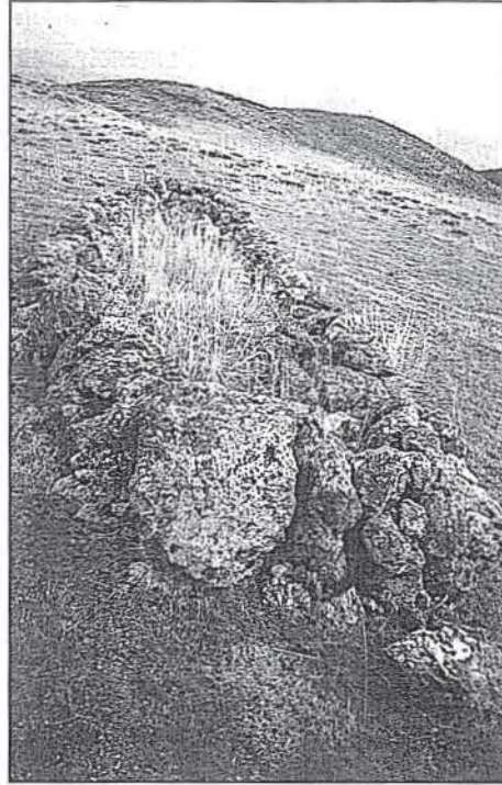
Sarı Kız Yatırı (Hisarcık Köyü)