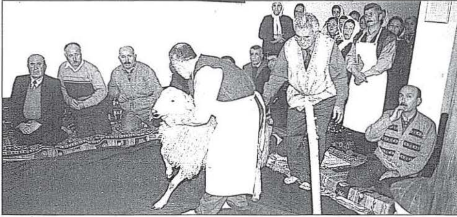
Hisarcık Köyü Cem Töreni- Kurban Tığlama

Cem törenlerinin en önemli özelliklerinden birisi, fertlerinin tamamının birbirlerini tanıdığı, çoğunlukla aralarında akrabalık ilişkilerinin bulunduğu törenler olması ve genellikle yabancıların