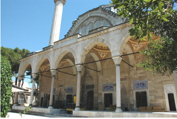
Foto. 1- Manisa Muradiye Camii.

kadınlar mahfilindeki ikinci kat pencerelerinin alınlıklarında, İznik üretimi kırmızılı sıraltı teknikli çiniler kullanılmıştır (Plan 1/a-n). Son cemaat yerinde yer alan dört pencerenin alınlığında da benzer çini süsleme görülür 4 (Foto. 1, Plan 1/o-s).