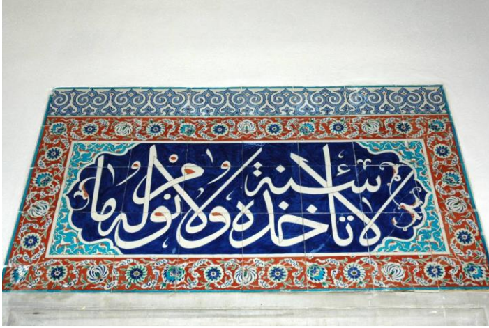
Foto. 7- Manisa Müzesi'nden getirilen çinilerle tamamlanan pano.

Harimin batı duvarındaki pencerelerin ikisinin de alınlığındaki çiniler çalınmıştır. Kuzeydeki alınlığı oluşturan, kare ve dikdörtgen formlu 40 adet çini plakanın tamamı alınmış, güneydekinin ise beşi yarım olmak üzere, yedi plaka yerlerinden çıkarılmadıkları için kalmıştır (Foto. 8, 10). Tahribatin büyüklüğünü gözler