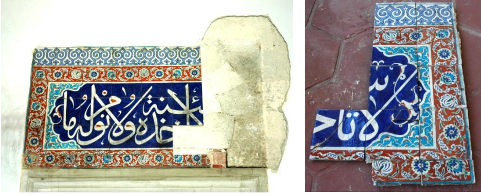
Foto. 5, 6- Harimin doğu duvarındaki pencerenin alınlığı (Plan 1/g). Hırsızlık sonrası Manisa Müzesi'nde koruma altına alınan çiniler.

bırakılmıştır (Foto. 5, 6). Çini plakalardan yedi tanesi tam, dördü parçalıdır. Manisa Müzesi'ne kaldırılan bu çiniler, restorasyonda birleştirilmiş ve yerine monte edilerek, panonun orijinalliği korunmuştur. Küçük sır ve bezeme eksiklikleri de alçı üzerine kalemişiyle onarılarak kapatılmıştır (Foto. 7).