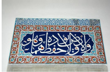
Foto. 10, 11- Harimin batı duvarındaki güney pencerenin alınlığı. Çalınan çiniler ve restorasyon sonrası (Plan 1/m).

2004 yılında yapılan hırsızlığın boyutları bu örneklerle anlaşılmaktadır. Alınlıkları oluşturan çini plakaların tamamı, bütünü bozmayacak şekilde götürülmeye çalışılmıştır. Bu da hırsızların işlerinde ne kadar profesyonel olduklarını ve belki de alıcıların önceden sipariş ettiği bu eşsiz sanat eserlerini acımadan nasıl harap ettiklerini göstermektedir. Harimin batı duvarındaki güney pencerenin alınlığından geriye kalan kırk çinilerin görüntüsü acı vericidir. 421 yıl önce özenle yerleştirilen çiniler, götürülmeye direnmiş gibidirler. Aslında caminin maruz kaldığı ilk hırsızlık bu değildir. Yıllar önce, mahfilin güney duvarındaki pencerelerden batıdaki alınlığındaki çini plakalar da çalınmıştır. 24 çini plakadan oluşan bu alınlık da, yıllardır bir utanç tablosu