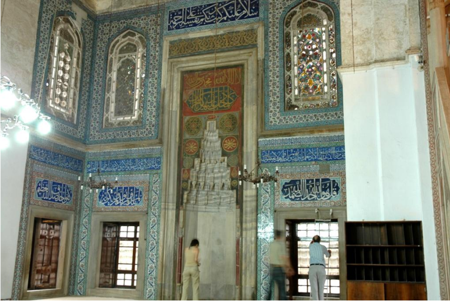
Foto. 2- Manisa Muradiye Camii'nin mihrap duvarı.

Mihrabın kalem işleriyle bezeli tepeliğinin hemen üzerinde dikdörtgen bir kitabe panosu yer alır. Kitabeyi çevreleyen ince bordürde, gül ve rozetler tekrarlanmış, bunların aralarına kıvrık dişli yapraklar yerleştirilmiştir.