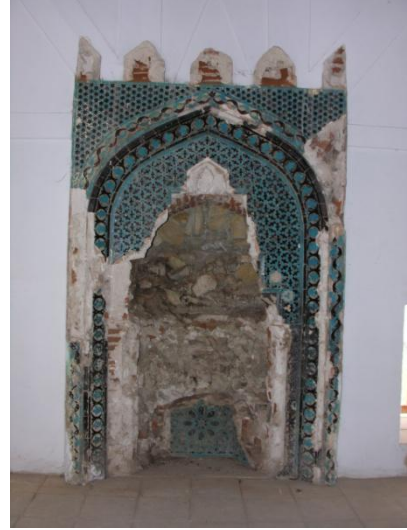
Foto. 14, 15- Elazığ/Harput Arap Baba Mescidi'nin çini mozayik mihrabı.