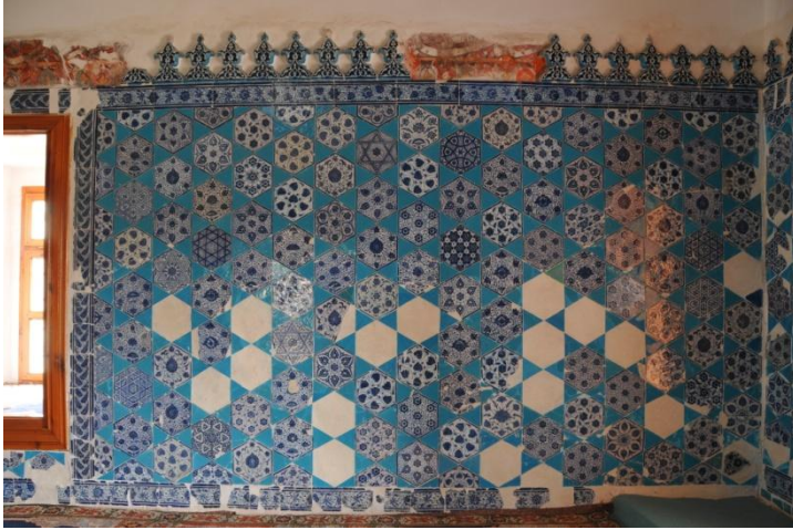
Foto. 16- Edirne Muradiye Camii, harim duvarları.