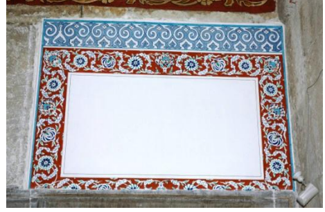
Foto. 12, 13- Harimin mahfilin güney duvarındaki pencerelerden batıdakinin alınlığı. Çalınan çiniler ve restorasyon sonrası.

Ne acıdır ki yalnızca Manisa Muradiye Camii değil, birçok yapının eşsiz çinileri bu talihsiz olaylardan nasibini almıştır. 1279-1280 tarihinde inşa edilmiş olan Harput Arap Baba Mescidi'nin çini mozayik teknikli mihrabı, acımasızca tahrip edilmiş, yüzyıllara direnen mihrap, tarihi eser yağmacılarına direnememiştir. 2002 yılında eseri ziyaret ettiğimizde bu manzarayla karşılaşmak bizi inanılmaz üzmüştür (Foto. 14, 15).