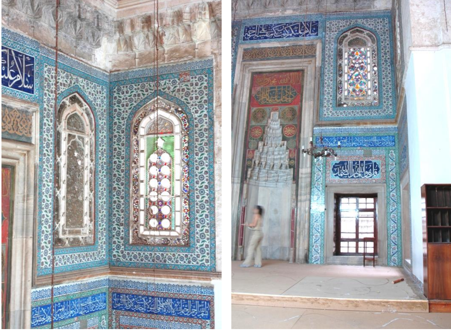
Foto. 3, 4- Manisa Muradiye Camii'nin mihrap duvarındaki çinileri.

Yapıdaki bütün çini panoların üzerinde stilize rumi ve palmetlerden oluşan süsleme bordürü bulunmaktadır. Bu bordürlerde, uçları sivri ve kıvrık, stilize rumi ve palmetler atlamalı bir şekilde yerleştirilmiştir. Firuze renkli rumi ve palmetler, beyaz zeminde, altta küçük palmetler oluşturarak son bulur (Foto. 5).