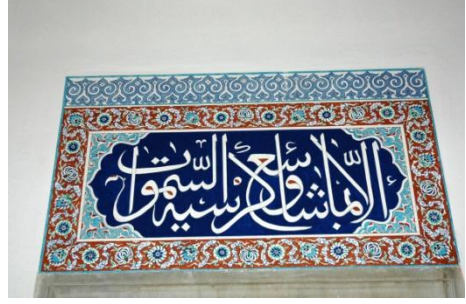
Foto. 8, 9- Harimin batı duvarındaki kuzey pencerenin alınlığı. Çalınan çiniler ve restorasyon sonrası (Plan 1/1).