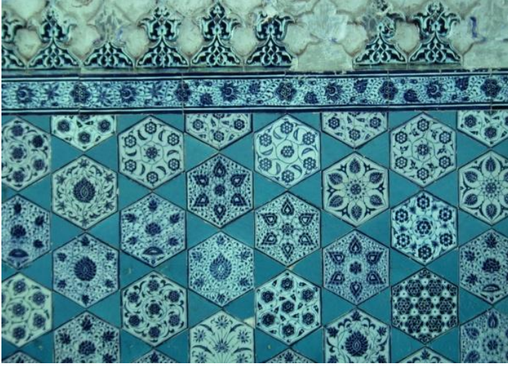
Foto. 16- Edirne Muradiye Camii, harim duvarları.

Çinilerimize yapılan saldırılardan biri diğeri de Edirne Muradiye Camii'nde gerçekleşmiştir. 1436 yılında inşası tamamlanan yapının İznik üretimi “mavi beyaz” sıraltı teknikli çinileri, kazmalarla sökülerek götürülmüştür (Foto. 16-17). Maalesef örnekler yalnızca bunlarla da sınırlı değildir ve günümüzde de bu tahribat hız kesmeden devam etmektedir. Umarız, yitip giden bu değerlerimiz bulunup, ait oldukları yerlerine iade edilirler.