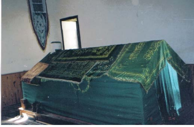
Resim 11- Mahmûd Seydî Sandukası