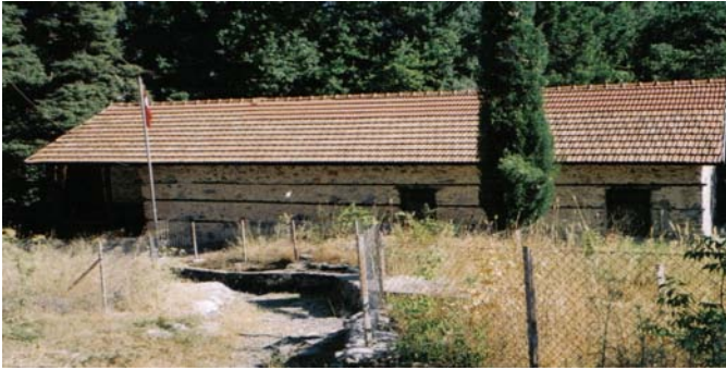
Resim 9- Mahmûd Seydî Zâviye ve Türbesi, Genel Görünüm