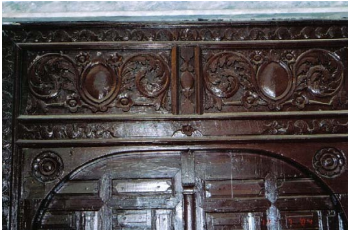
Resim 3- Mahmûd Seydî Câmii, Giriş Kapısından Detay