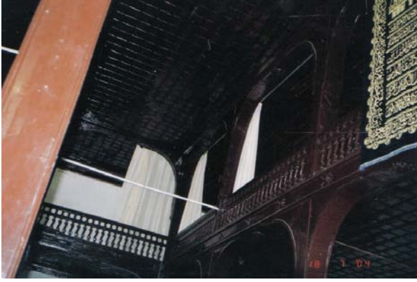
Resim 8- Mahmûd Seydî Câmii, Kadınlar Mahfili ve Örtü Sistemi