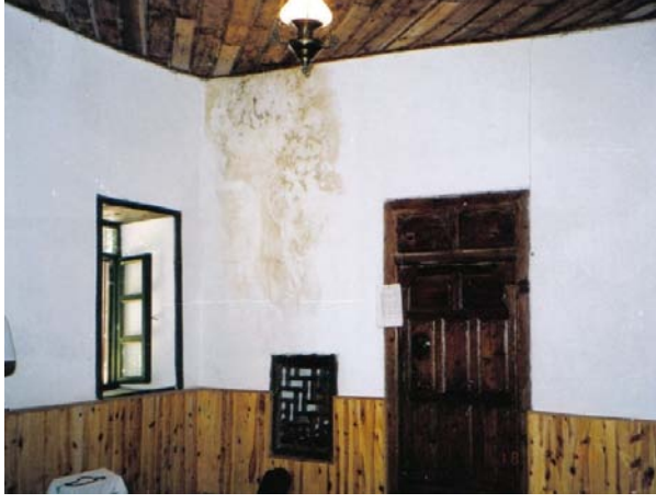
Resim 10- Mahmûd Seydî Zâviyesi, İç Mekândan Görünüş