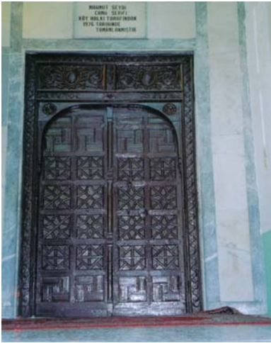
Resim 2- Mahmûd Seydî Câmii, Giriş Kapısı