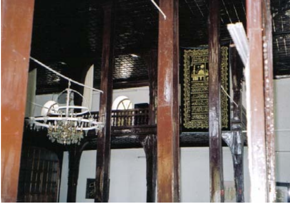
Resim 7- Mahmûd Seydî Câmii, Taşıyıcı ve Örtü Sistemi