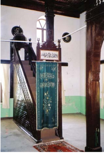
Resim 5- Mahmûd Seydî Câmii, Minber