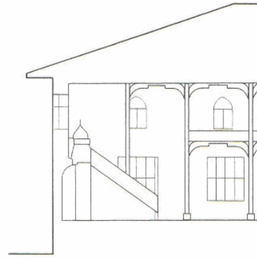
Çizim 2- Alanya Mahmud Seydi Köyü