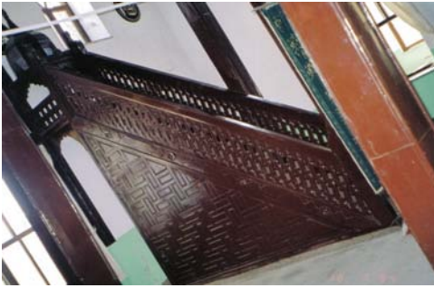
Resim 6- Mahmûd Seydî Câmii, Minberden Detay