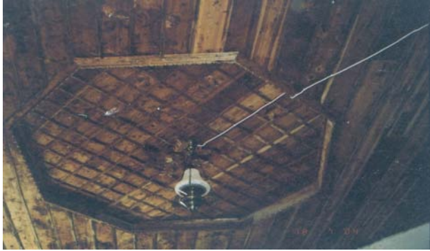
Resim 12- Mahmûd Seydî Türbesi, Tavan Göbeği