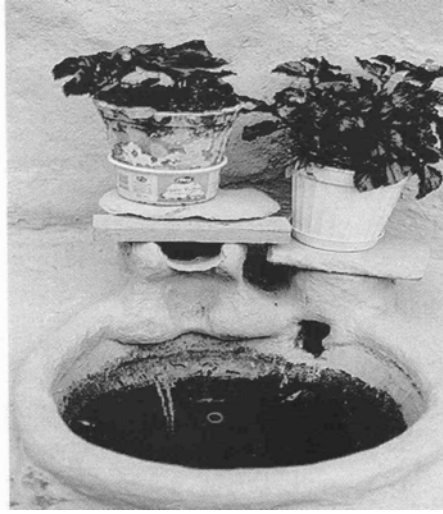
Resim 2: Bursa evlerinin bahçelerinde bulunan su kuyusu. (Özer, age., s. 29)