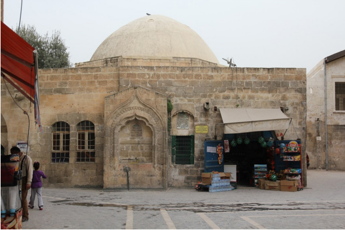
Resim 1. Tekye-i Cedîde (Bugünkü adıyla Şeyh Safvet Tekkesi)

Şeyh Ramazan Efendi Rebiu'l-ahir 1069/ Ocak 1659 tarihli vakfiyesinde bina eylediğini belirttiği "Tekye-i Cedîde", Elli Sekiz Meydanı diye bilinen ve kayıtlarda Kurtuluş Mahallesi adıyla geçen mahalledeki Halvetiye tekkesidir. Bu tekke günümüzde Şeyh Safvet Tekkesi olarak bilinmektedir. Tekke bugünkü adını Halvetiye şeyhi olan Şeyh Safvet Efendi'den almaktadır. Şeyh Safvet Efendi, Dârü'l-Hikmeti'l-İslâmiye'de görev yapmış, Meclis-i Mebusan ve Cumhuriyet döneminde iki dönem mebusluk yapmıştır. Elli iki arkadaşıyla hilafetin kaldırılması için önerge vermiş bir zattır. Tekkenin ismi onunla şöhret bulmuştur (bkz. Özdemir 2014).