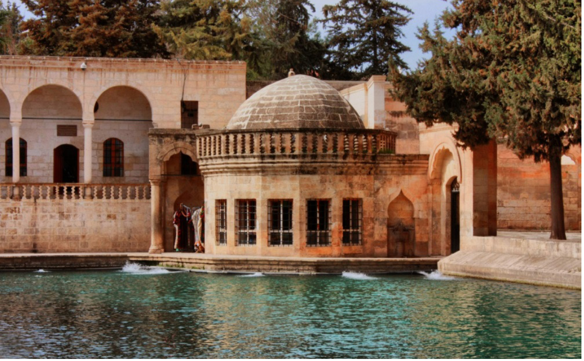
Resim 2. Ayn-ı Halilürrahman Zaviyesi'ne ait şeyh odası

edilen bu odaya konulmuş olduğu ve buranın bir kütüphane mahiyetine geldiğini söyleyebiliriz.