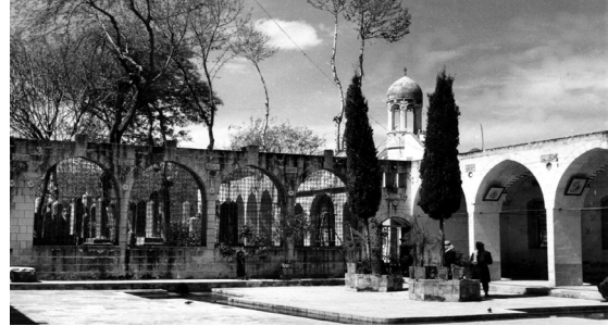
Resim 3. Mevlûd-i Halilür-Rahman Külliyesi

herhangi bilgi mevcut değildir. Ancak bu kitapların bugün dahi bir kısmı Mevlûd-i Halilürrahman Camii'nin ziyaret girişi yanındaki bir odada sergilendiği bilinmektedir (Tenik 2002; 108).