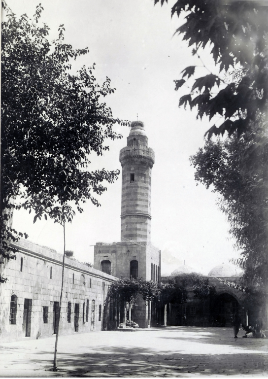
Resim 3. Mevlûd-i Halilü'r-Rahman Külliyesi

belirtilen diğer üç vakıftan farklı olarak tasarruf hakkı ile ilgili olarak vakıf kurucularının “ daha iyi bilen ve günah işlemekten korkan ” nesilden nesile erkek evlatlarına inkırazında ise aynı vasıflara sahip akrabalarına ve bunların dahi inkırazında bu kitapların Hameyn-i Ş-Şerifeyn kütüphanelerine konulmasını şart koştukları anlaşılmaktadır. Yani bu kitapların istifadesi öncelikle kendi nesillerine bırakılmış olup, nesillerinin inkırazında ise kitapların şehirde bırakılmaması ve Hameyn-i Ş-Şerifeyn kütüphanelerine gönderilmesi şart konulmuştur. Bu şartların dikkat çekici tarafı vakfedilenin menkul ve gayrimenkul olmamasına