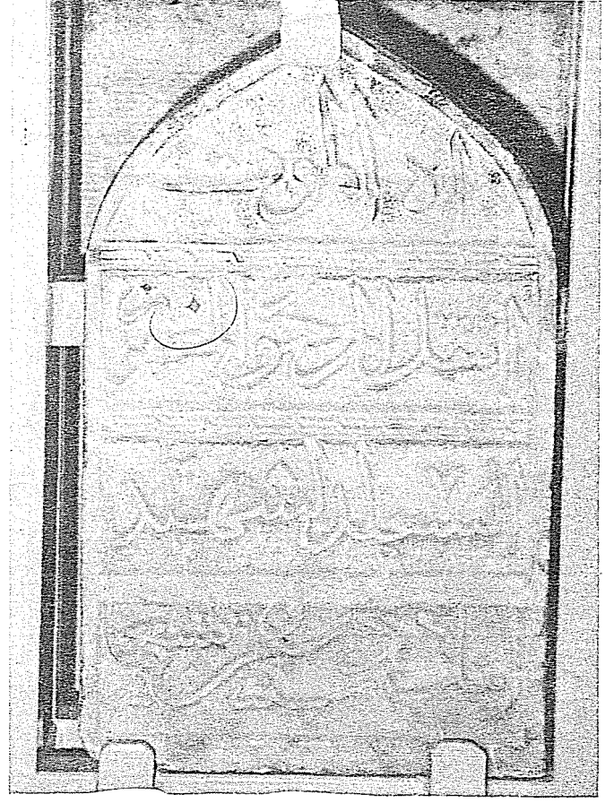
Resim 3: Inel Dede'nin Mezar Kitabesi