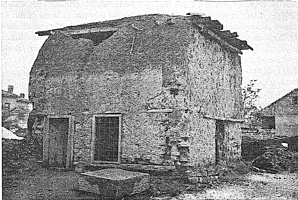
Resim 1: Mahmûd Dede Türbesi (Konya)