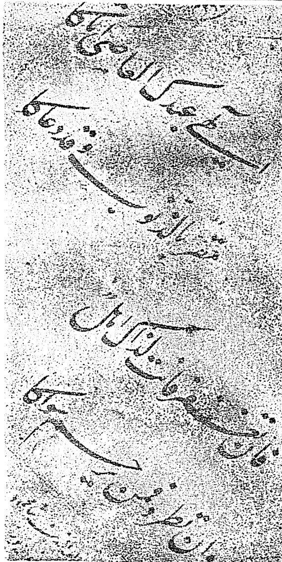
Resim : 4