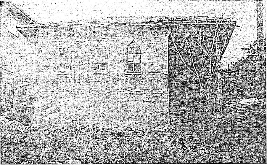
Res. 1. Yukarı Oda (Restorasyondan önce)