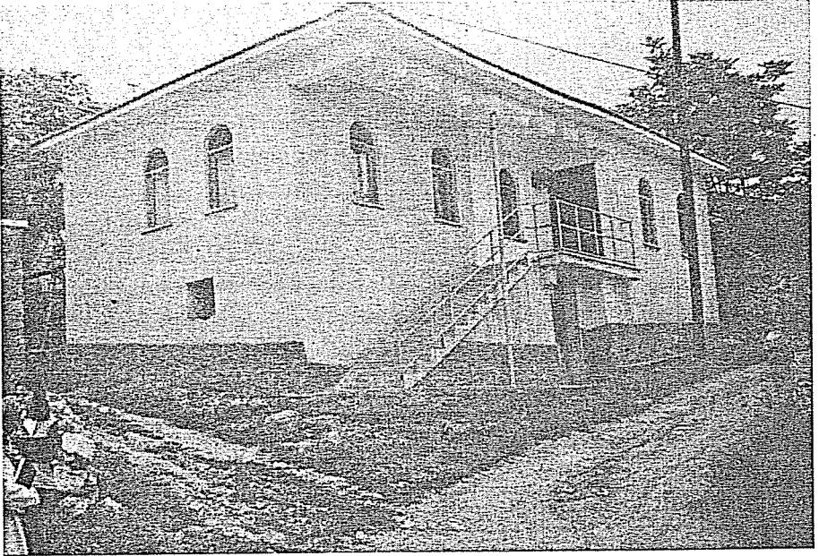
Res. 4. Hacıođlu Odası