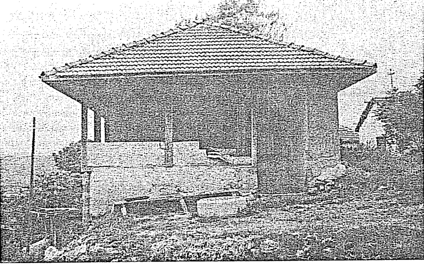
Res. 3. Aliađagilin Odası