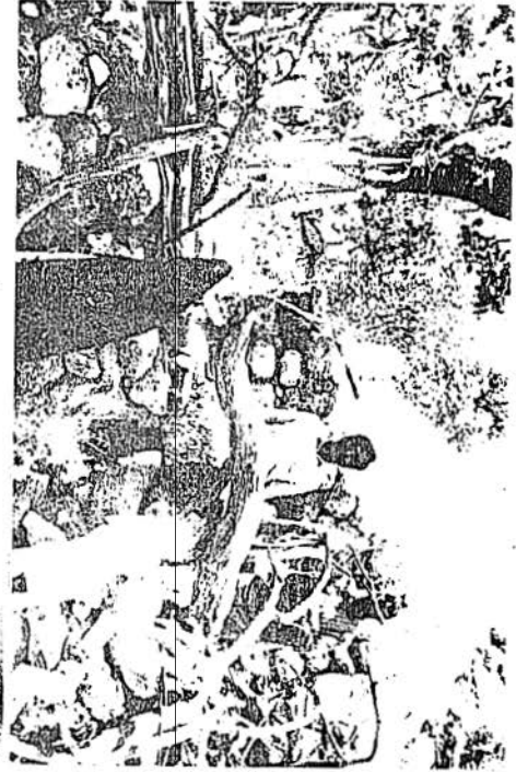
V-Yezîdîlerde Yatır ziyareti. Şeyh Bilkâsım.Şeyh Teto Sencer ve muhtar Ömer Çelik.Nusaybin.