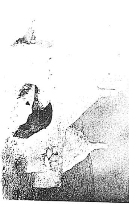
III -Hasan Bey Mezarlığında başka bir mezar tipi.Çilesiz,Nusaybin.