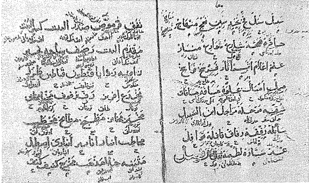
Yozgat, Maarif Kütüphanesi, al-Zamahşarî, Mukaddimat al-adab , isimler kısmından bir parça.