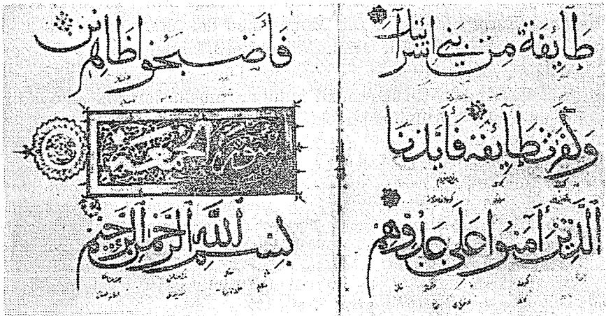
Resim 2 — John Rylands Library, Manchester'deki, ms 773, Hâkânî Türk devrinden cüz'lerden varak. 48/B ve 49. (Bkz. yuk. not. 12). Sûre LXI sonu ile LXII. sure (Cum'a) nın başıdır. Her satırın altında, üstünde farsca, alta Hâkânî Türk devri türkçesinde, meâl yazılıdır.