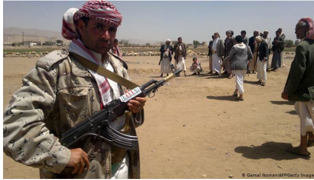
Resim 5: Günlük Hayatta Silahlı bir Hûsî Mensubu

Hûsîler, Yemen halkı ile giyiniş noktasında ayrılmayıp, halkın giydiği her türlü giysiyi giyerler. Lakin Cemaat mensupları ile halkın görünüşlerinde tek ve önemli bir fark vardır. Cemaat mensuplarının büyük çoğunluğu silahlarını sürekli omuzlarına asılı şekilde taşıyıp, günlük hayatlarında dahi bunu terk etmezler.