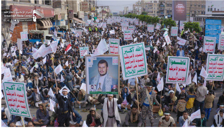
Resim 3: Hûsîler'in Aşura Günü Yürüyüşleri

almaz (el-HûsîA. a, 2018; ansarullah.com, 2017). İyice tetkik ettiğimizde, Cemaat'ın bu tarz etkinliklerinin aslının İsna Aşeriyye Şiası'nda olduğu gözlemlenebilir.