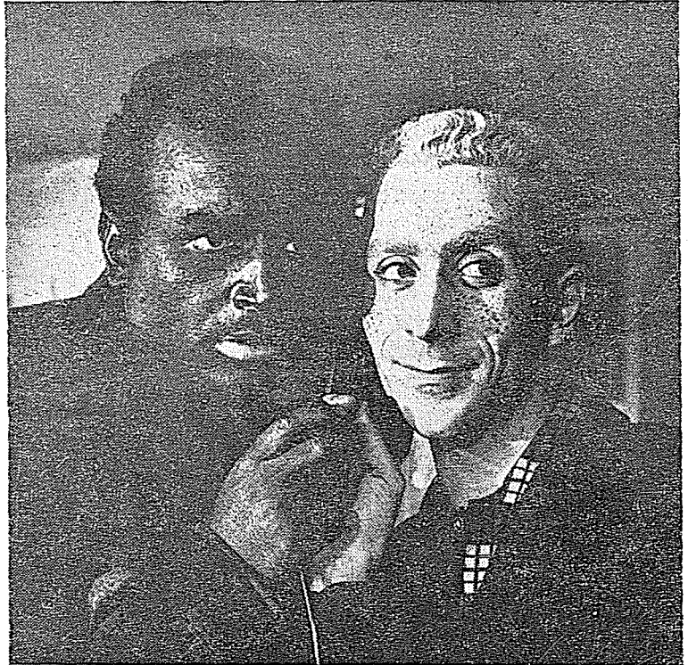
● «Ezilenler»den bir tablo.