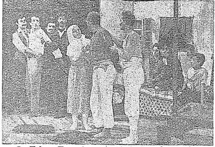
© Yalova Kaymakamı'nın bir bölümünde sanatçılar toplu halde...