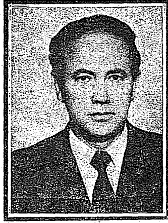
Fahri Gökcan (1933 — 1979)