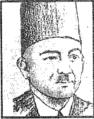
عبد الرحمن الرافعي ( ١٨٨٩ - ١٩٦٦ )

مؤرخ مصر في العصر الحديث . هو عبد الرحمن بن عبد اللطيف الرافعي ( الاخ الشقيق للكاتب السياسي امين الرافعي ) . ولد في الزقازيق (مصر) وقيل في القاهرة ، وفيها تلقى تعليمه . درس القانون في ( مدرسة الحقوق الخديوية ) ونال شهادتها ( ١٩٠٨ ) واشتغل بالمحاماة . انتسب الى الحزب الوطني بزعامة ( محمد فريد ) ورافقه لحضور مؤتمرات دولية في بروكسل ( بلجيكا ) وروما ( ايطاليا ) ١٩١٠ - ١٩١١ . انقطع الى اعمال الحزب والسياسة الى جانب عمله محاميا ( ١٩١٠ - ١٩٤٩ ) . سجن لمدة عام واحد حين ضبقت السلطات مذكراته السياسية ( ١٩١٤ ) . رشح نفسه وانتخب في اول مجلس نيابي مصري ( ١٩٢٤ ) ثم عضوا في مجلس الشيوخ ( ١٩٣٩ ) فرئيسا لل نقابة المحامين . تولى منصب ( وزارة التموين ) في حكومة